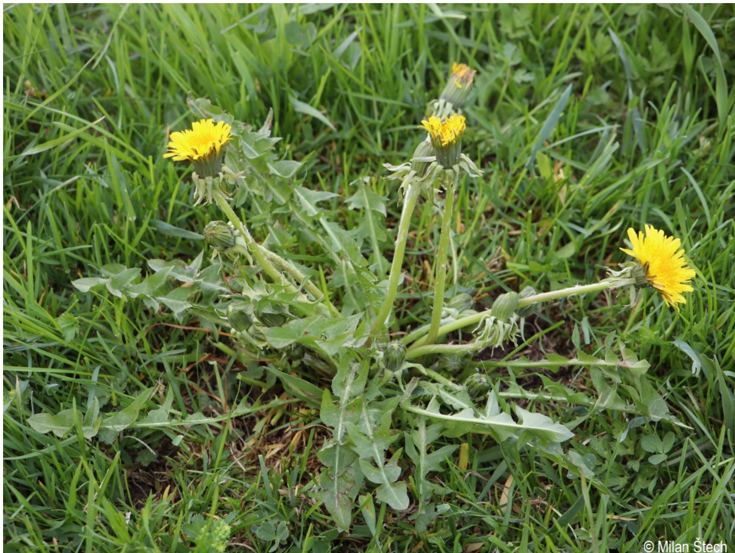
Taraxacum contractum – Milan Štech – Volary.