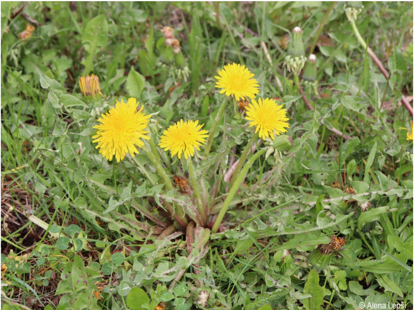
Taraxacum contractum – Alena Lepší – Srní, Mechov.