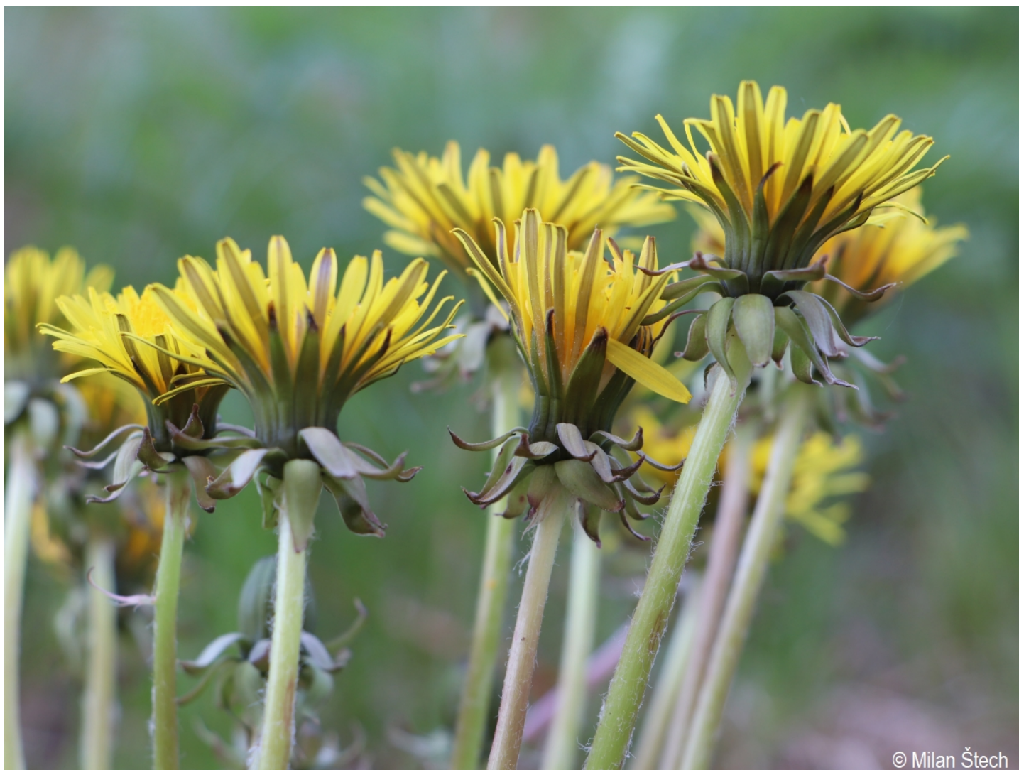
Taraxacum alatum – Milan Štech – Volary.