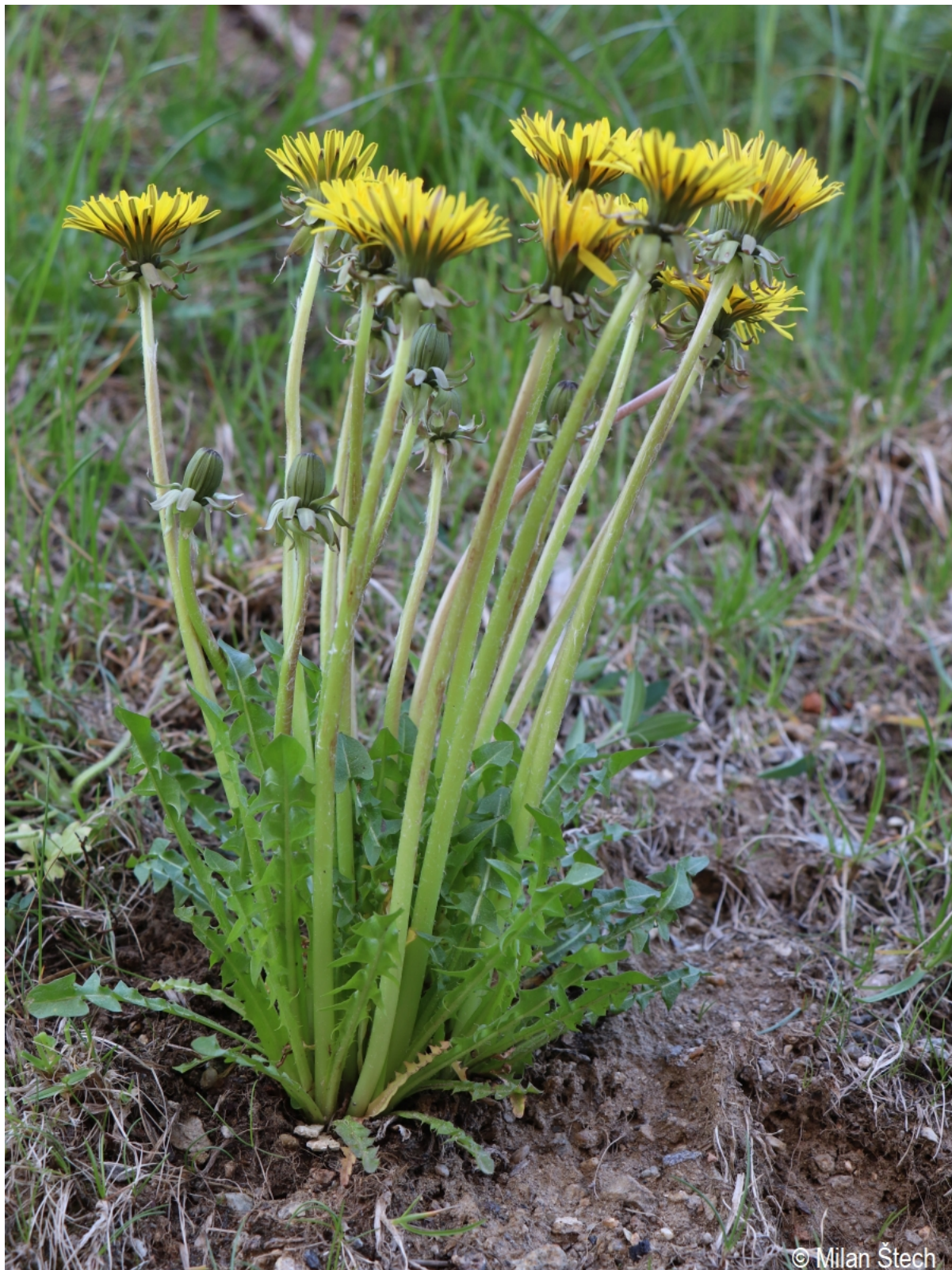
Taraxacum alatum – Milan Štech – Volary.