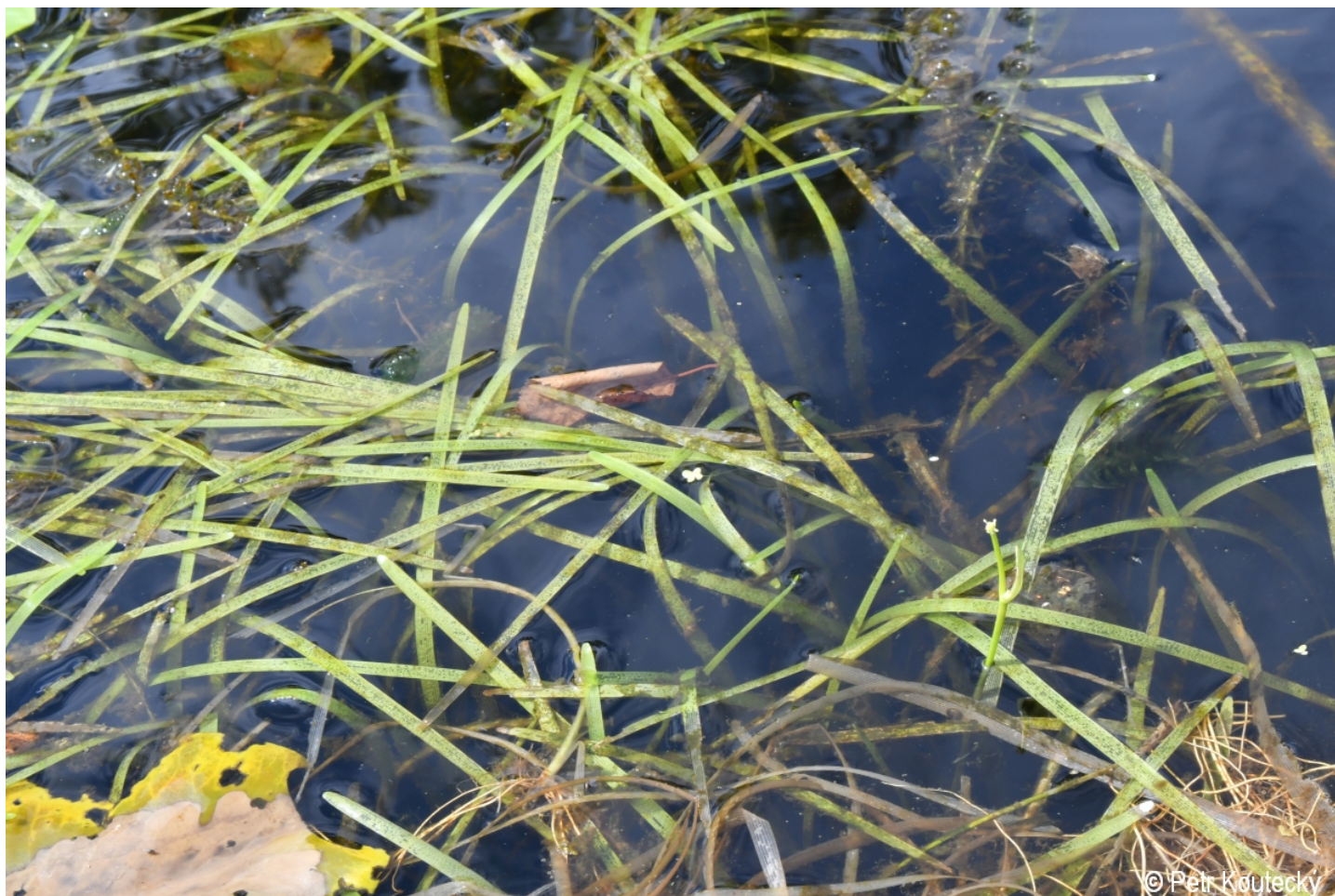
Sparganium natans – Petr Kouřecký – Dobrá, Vltavský luh.