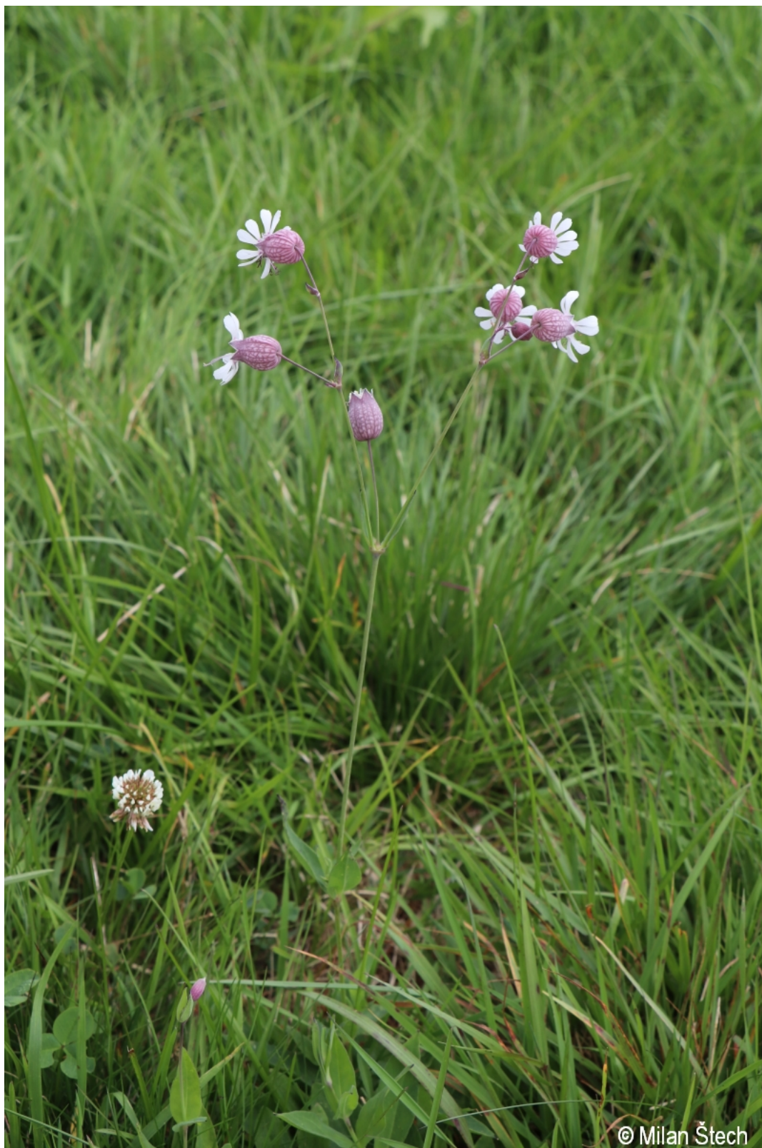
Silene vulgaris – Milan Štech – Velký Javor.