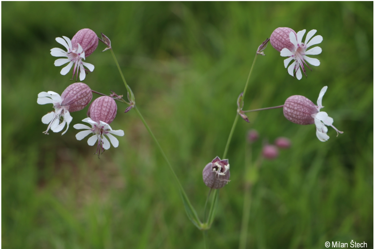
Silene vulgaris – Milan Štech – Velký Javor.