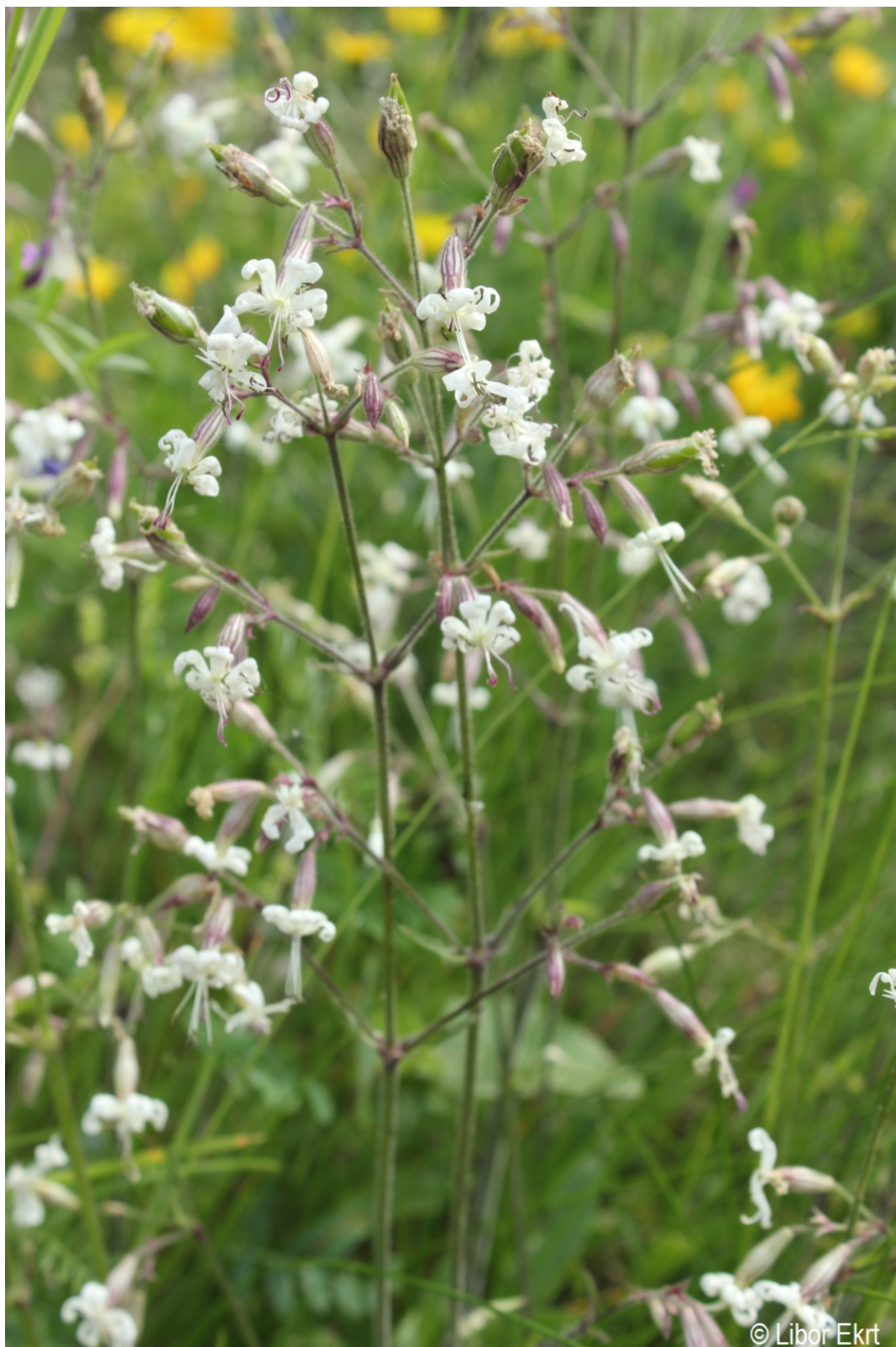
Silene nutans – Libor Ekrť – Hodňov.