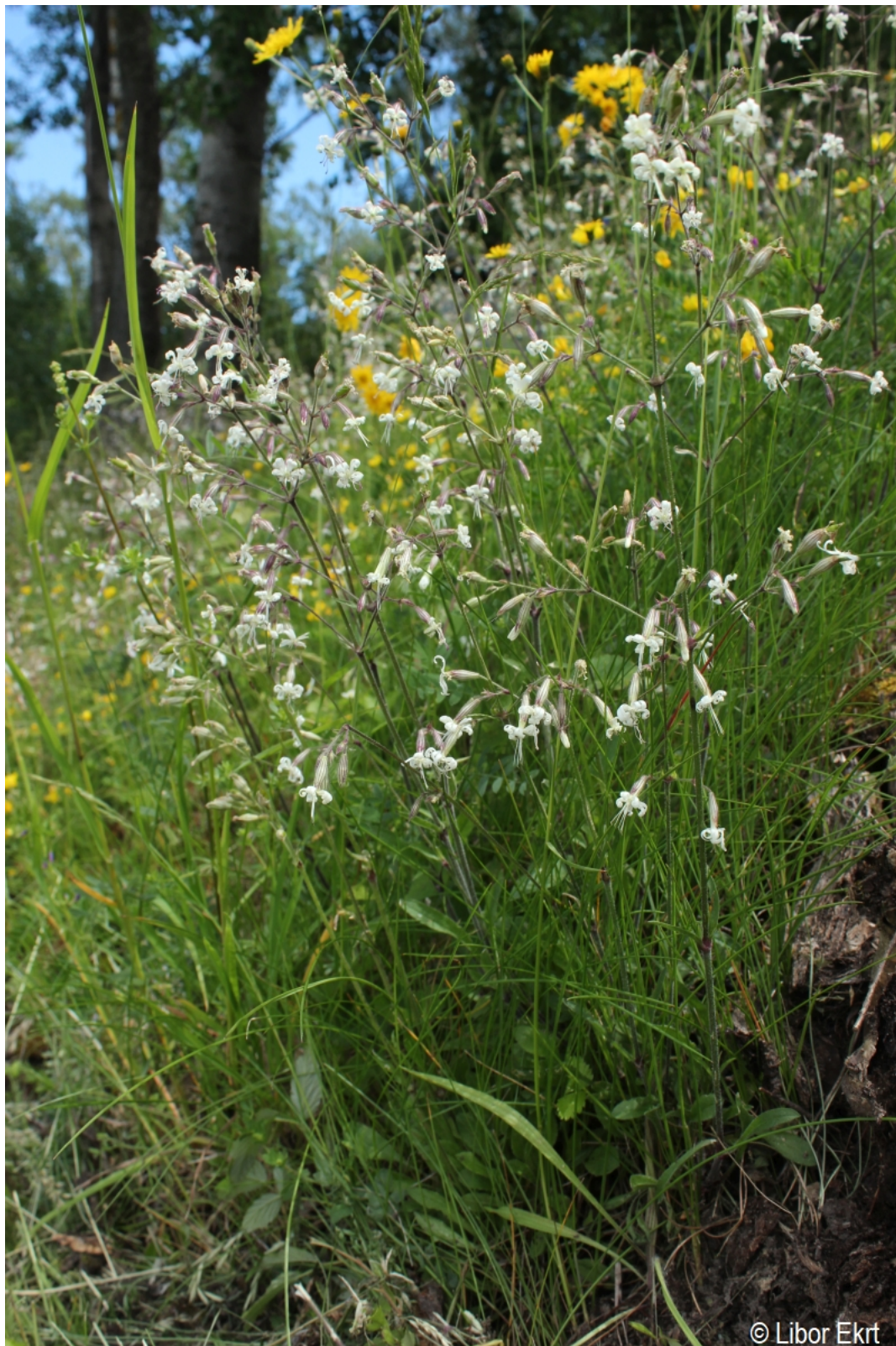
Silene nutans – Libor Ekrt – Hodňov.