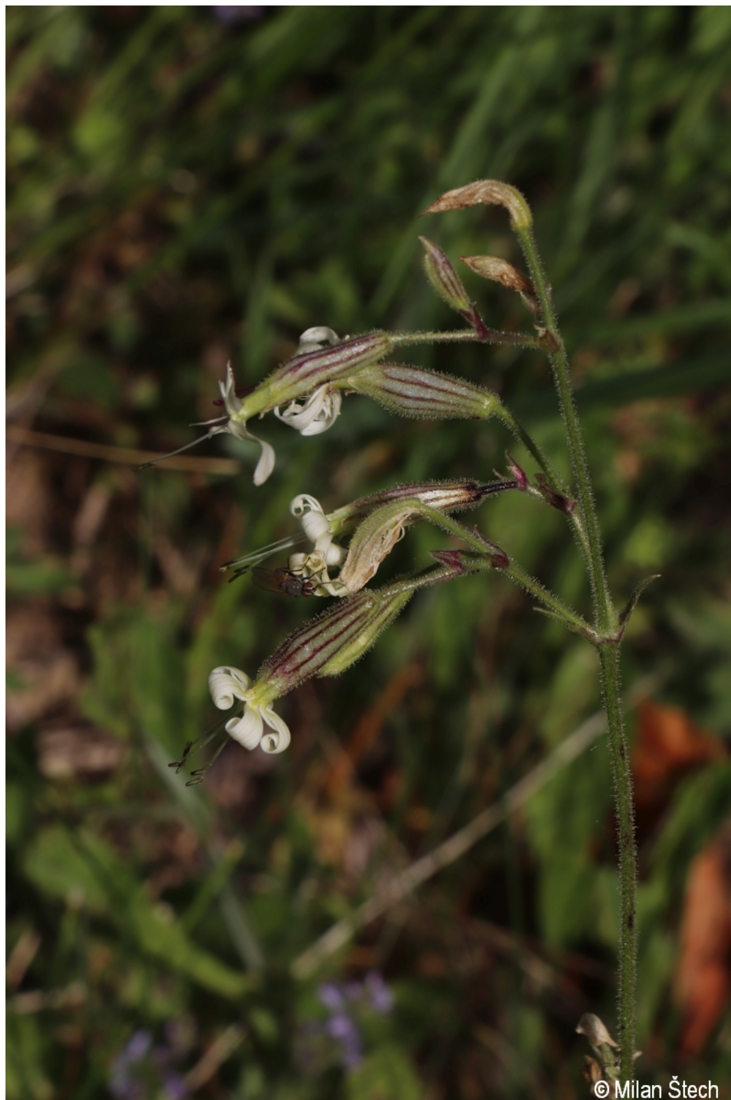
Silene nutans – Milan Štech – Rožnov.