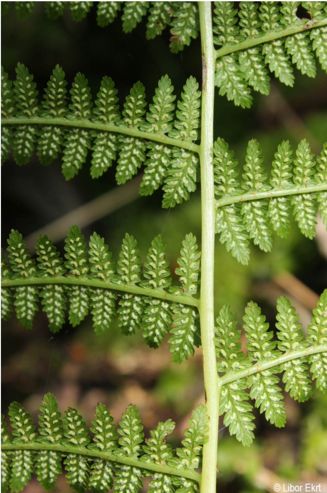
Athyrium filix-femina – Libor Ekrť – Házlův kříž.