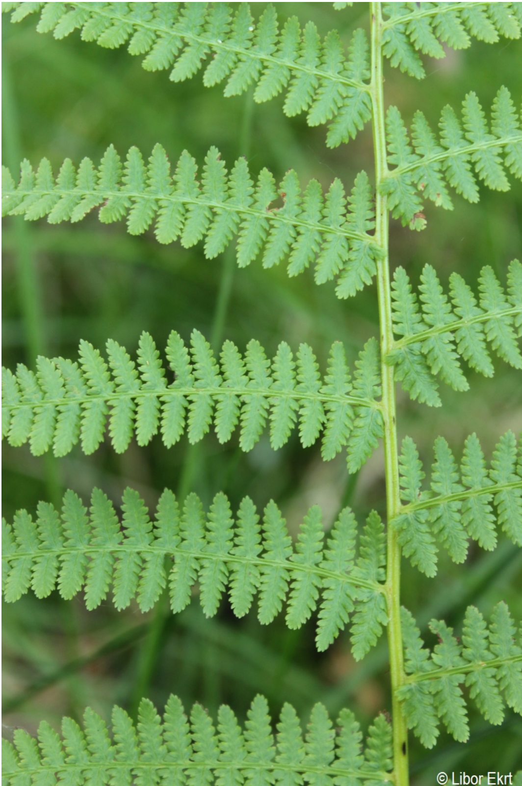
Athyrium filix-femina – Libor Ekrť – Házlův kříž.