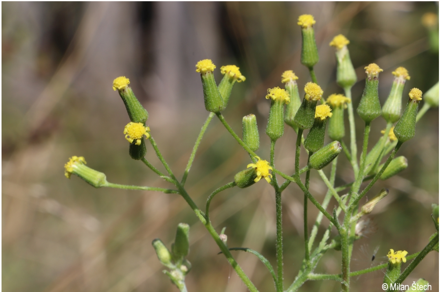
Senecio sylvaticus – Milan Štech – Kamenná Lhota.