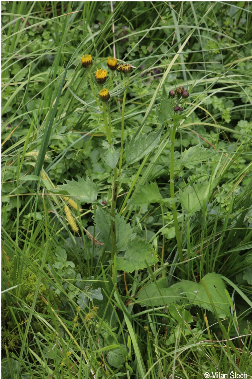
Senecio subalpinus – Milan Štech – Srní.