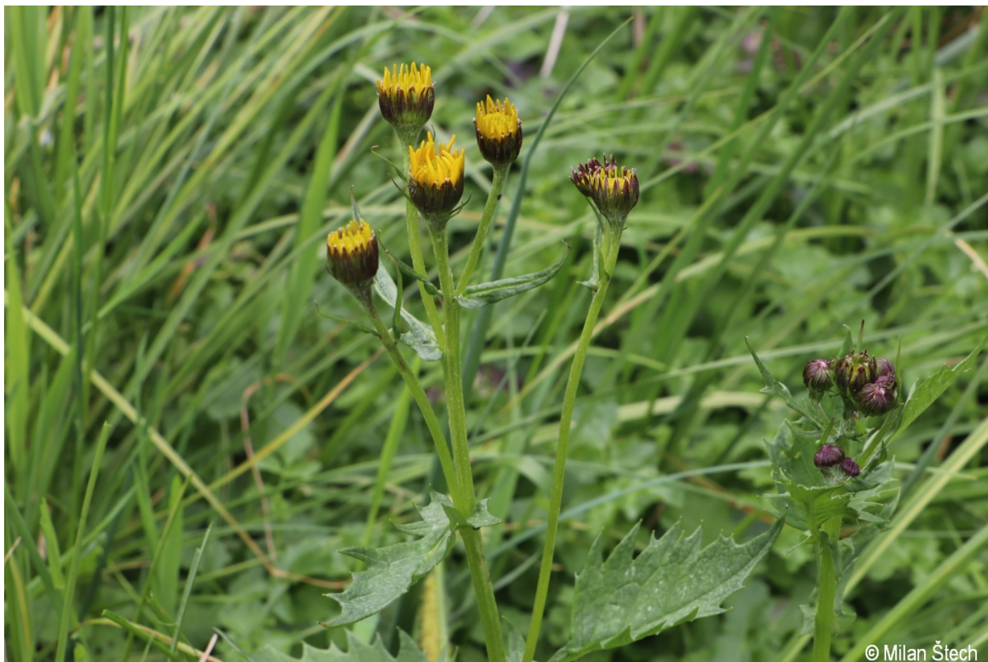
Senecio subalpinus – Milan Štech – Srní.