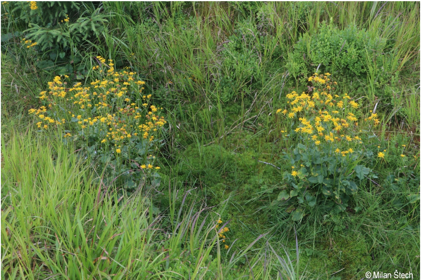
Senecio subalpinus – Milan Štech – Blatenská slať.