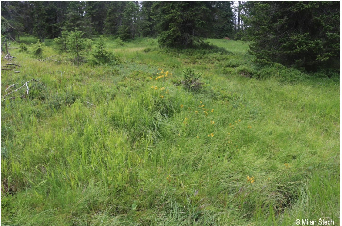
Senecio subalpinus – Milan Štech – Blatenská slať.