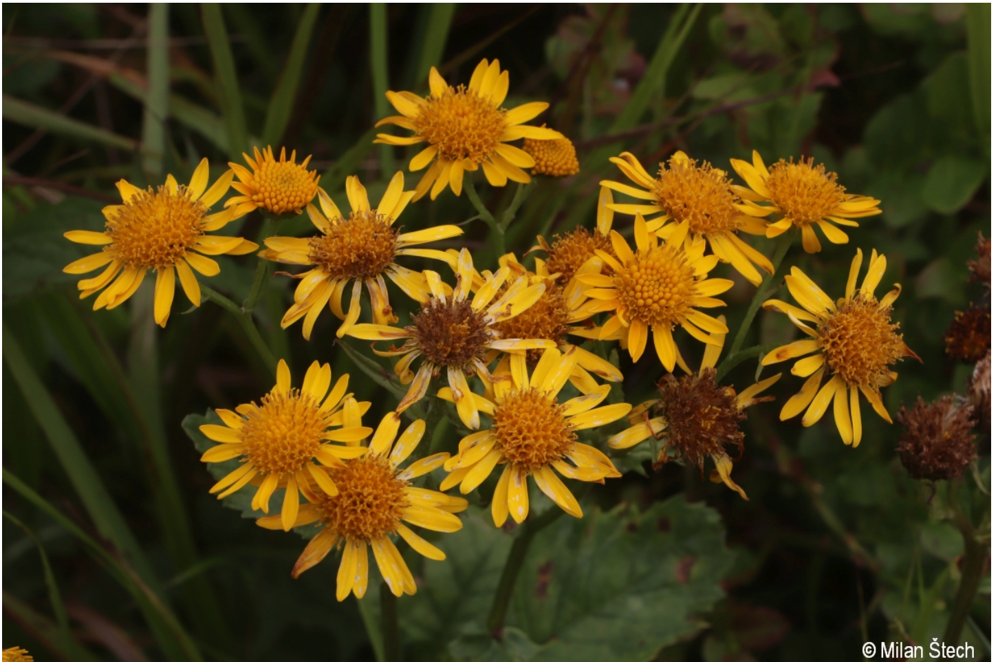
Senecio subalpinus – Milan Štech – Blatenská slať.