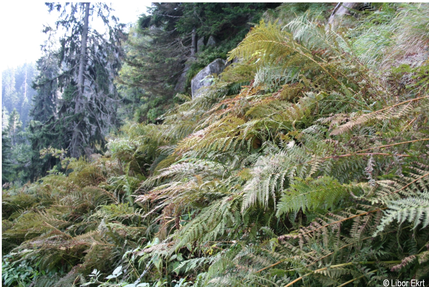
Athyrium distentifolium – Libor Ekrť – Plešné jezero.