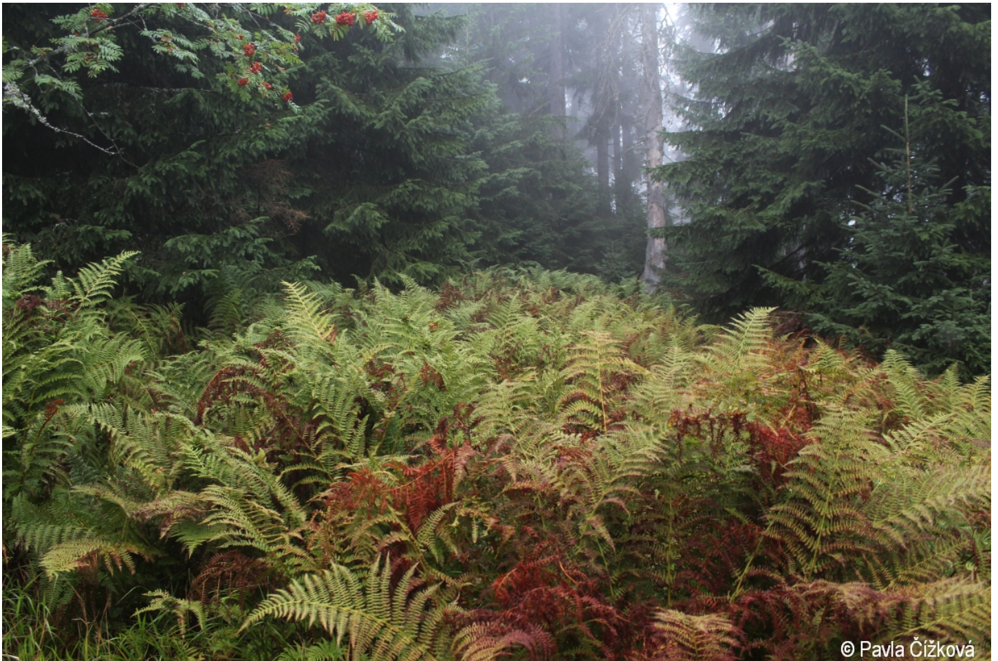
Athyrium distentifolium – Pavla Čížková – Smrčina (vrchol).