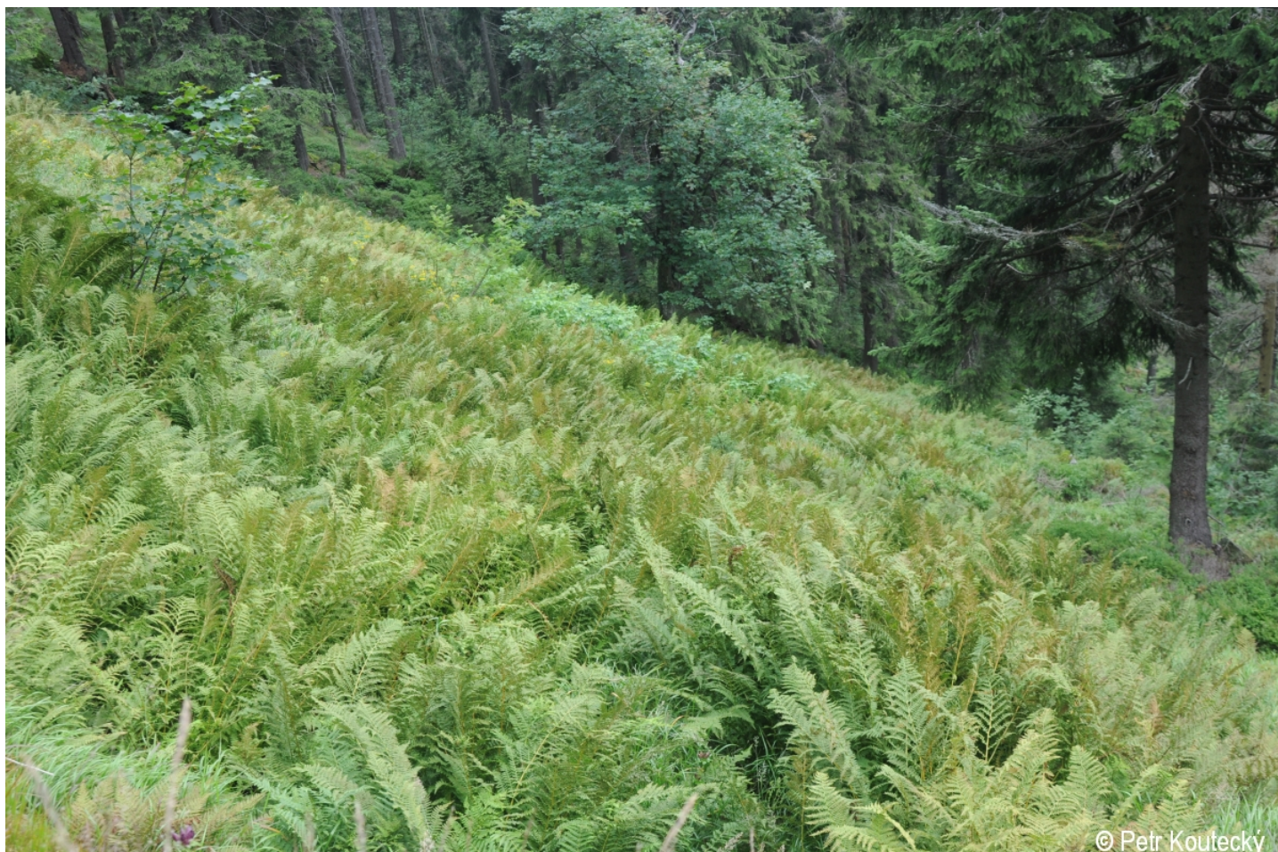
Athyrium distentifolium – Petr Koutecký – Černé jezero.