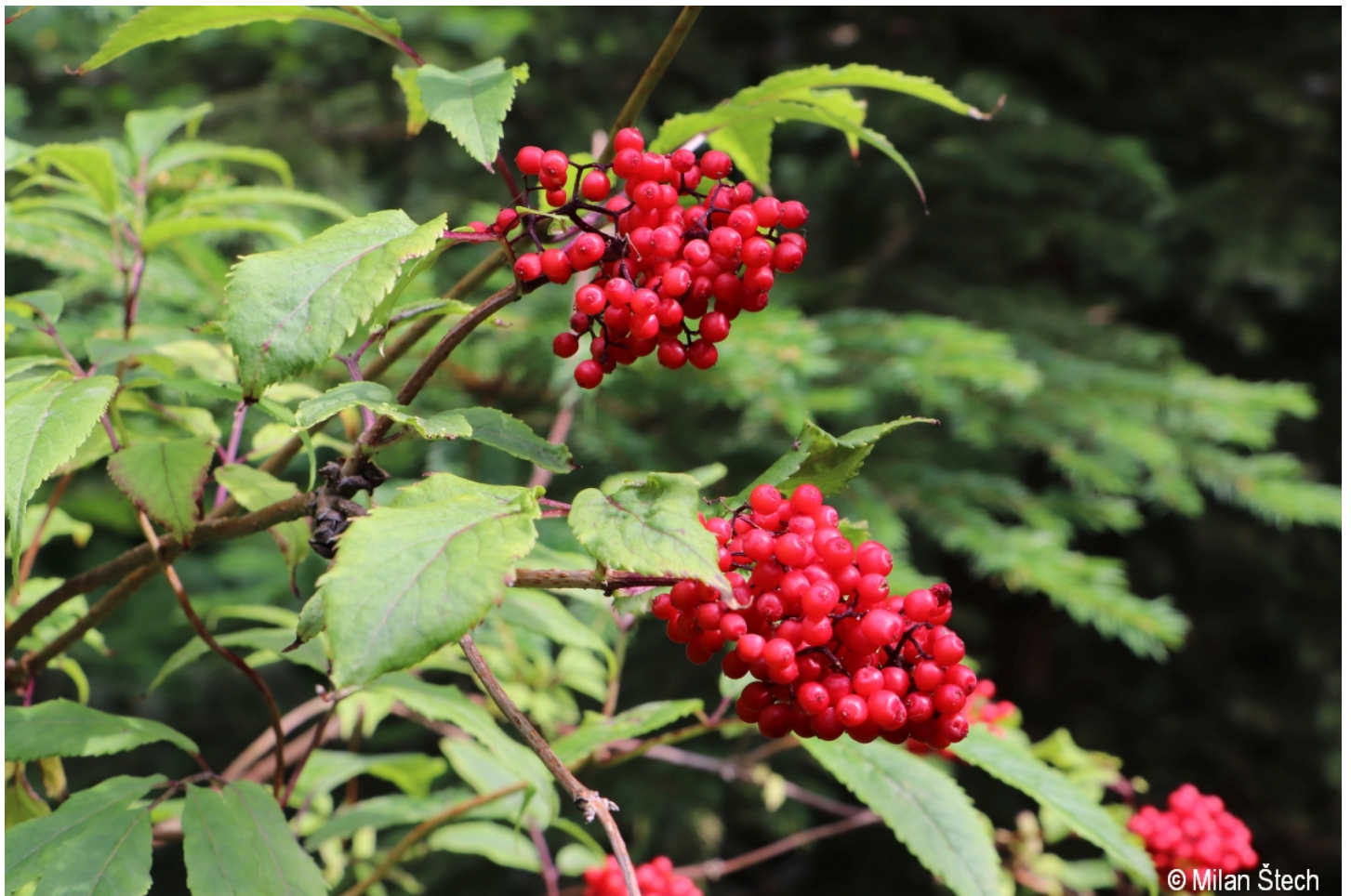
Sambucus racemosa – Milan Štech – Karlovy Dvory.