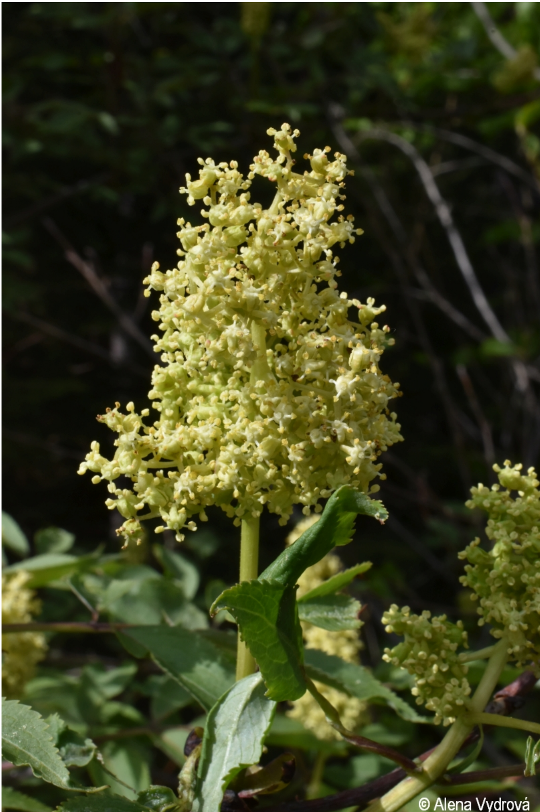
Sambucus racemosa – Alena Vydrová – Frymburk, Kaliště.