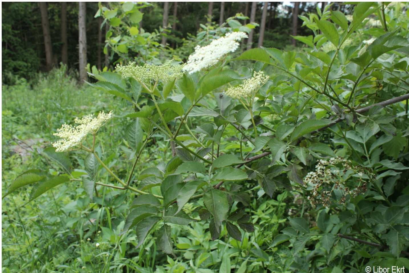
Sambucus nigra – Libor Ekrť – Černá v Pošumaví.