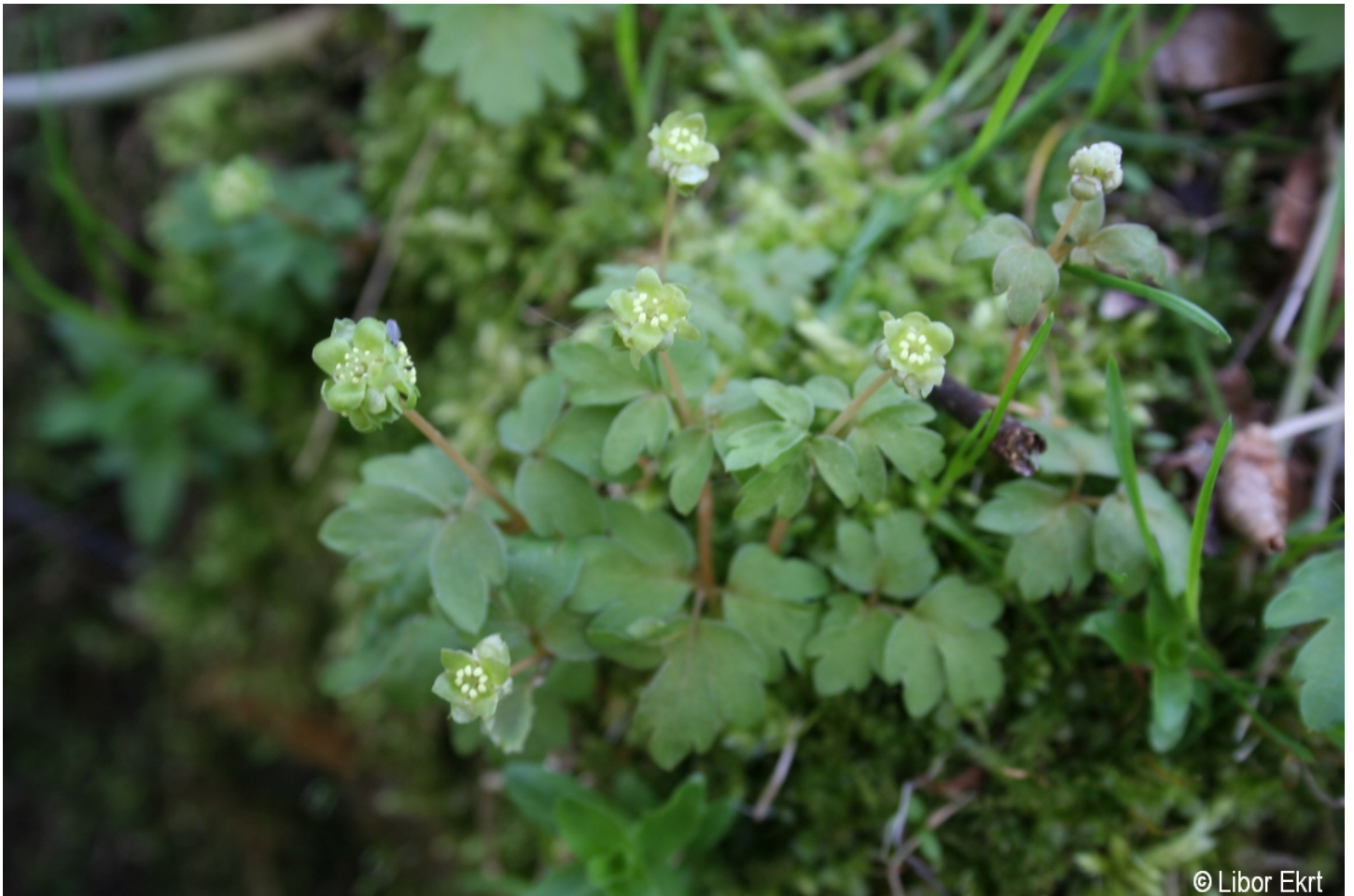
Adoxa moschatellina – Libor Ekrt – České Žleby.