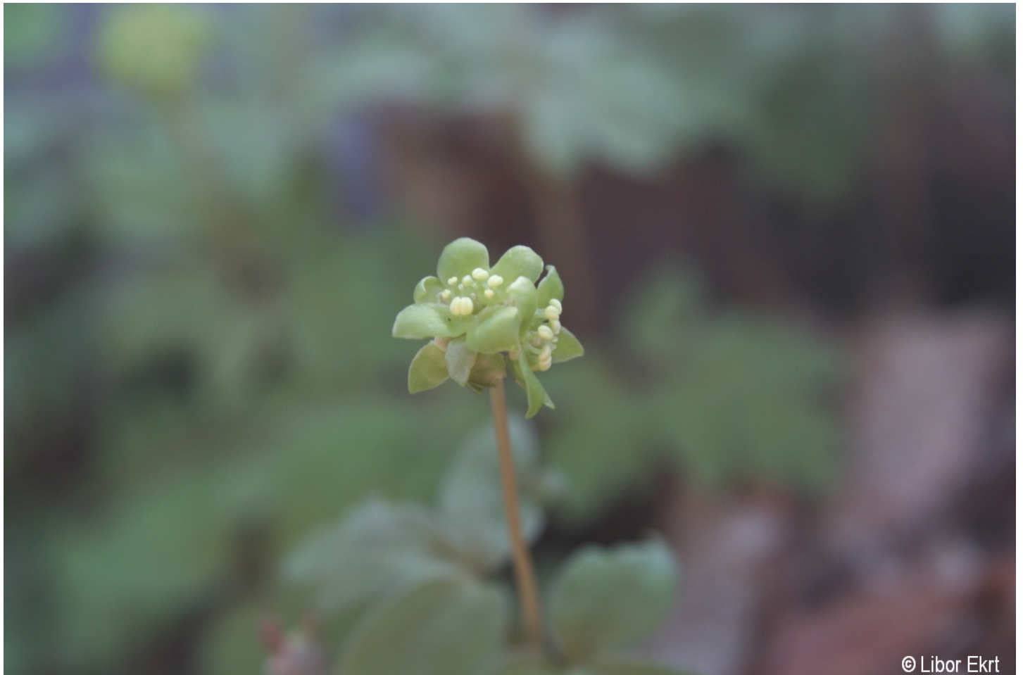
Adoxa moschatellina – Libor Ekrť – České Žleby.