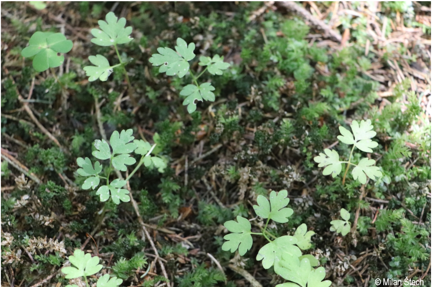
Adoxa moschatellina – Milan Štech – Horská Kvilda, Stará Huť u Zhůří.