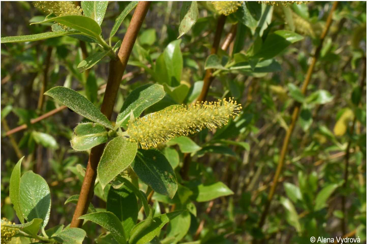
Salix pentandra – Alena Vydrová – Otice.