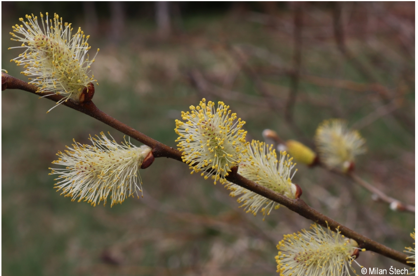
Salix aurita – Milan Štech – Hajný vrch.