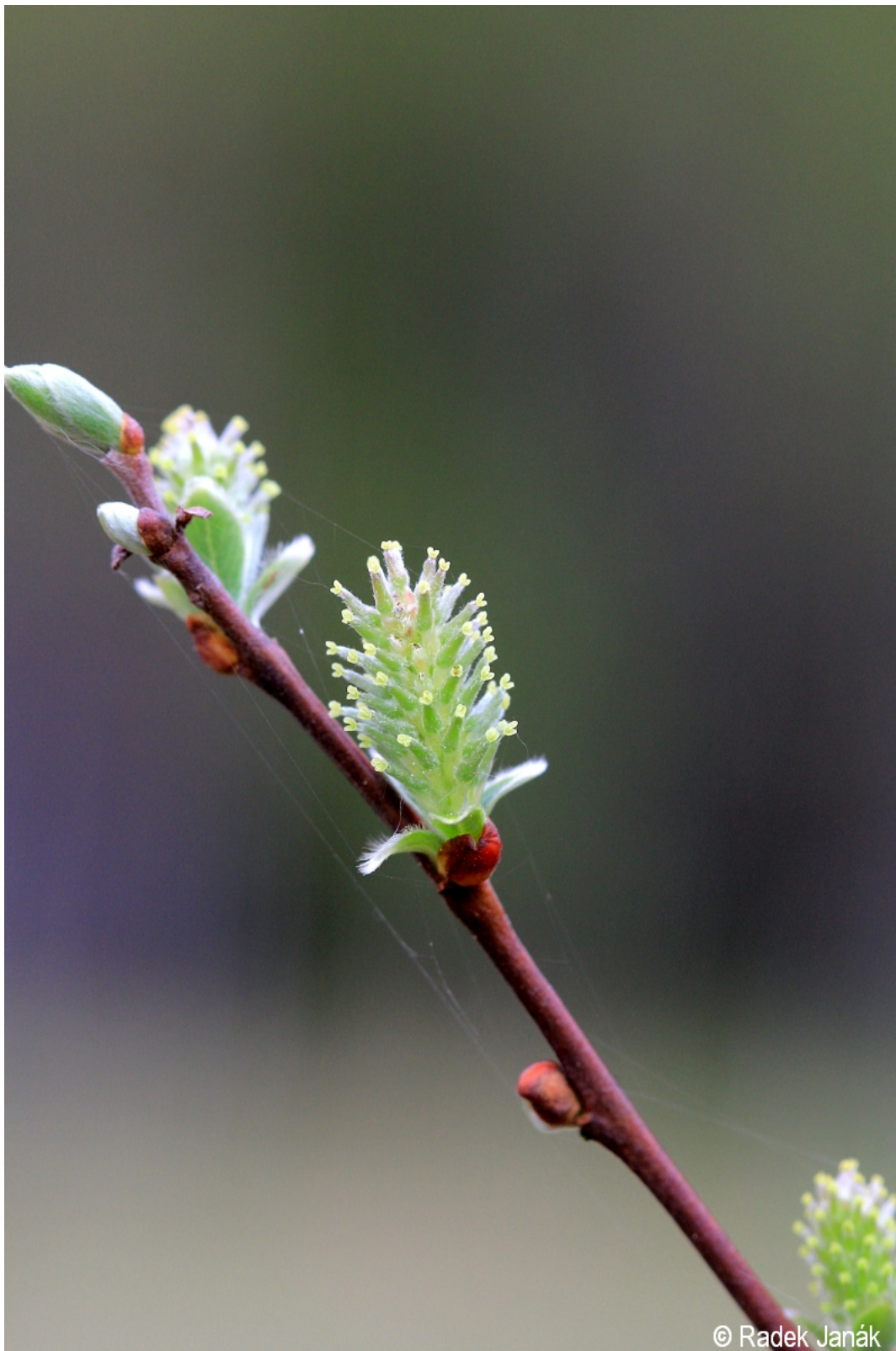
Salix aurita – Radek Janák – Vyšebrodsko.