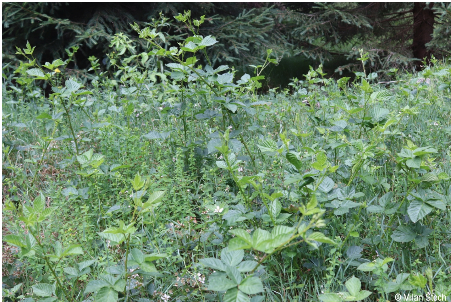
Rubus plicatus – Milan Štech – Debrník.