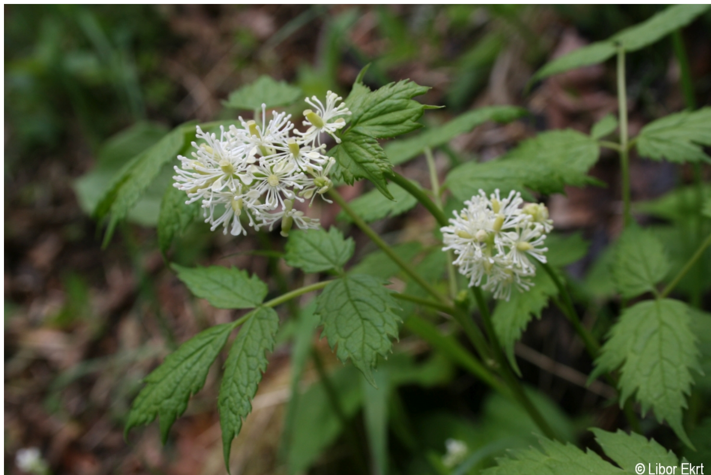
Actaea spicata – Libor Ekrť – Spáleníště.