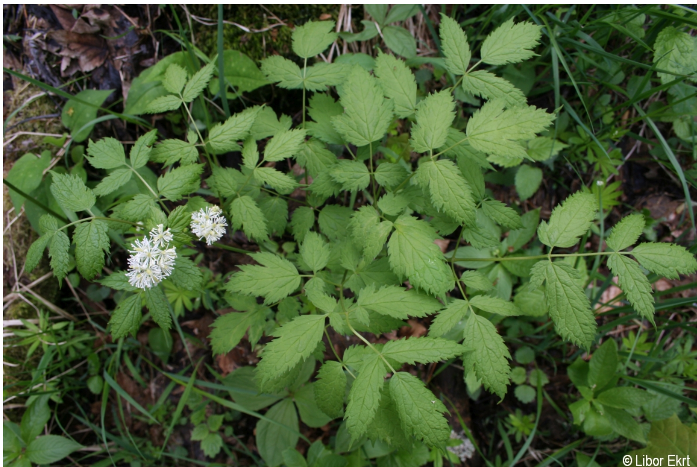
Actaea spicata – Libor Ekrť – Spáleníště.