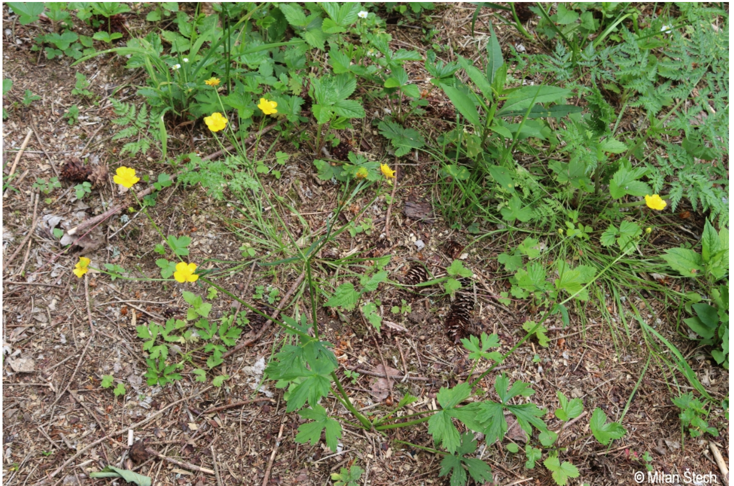
Ranunculus nemorosus – Milan Štech – Olšina, Suchý vrch.