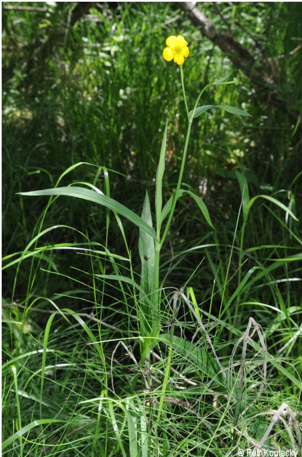
Ranunculus lingua – Petr Kouřecký – Olšina.