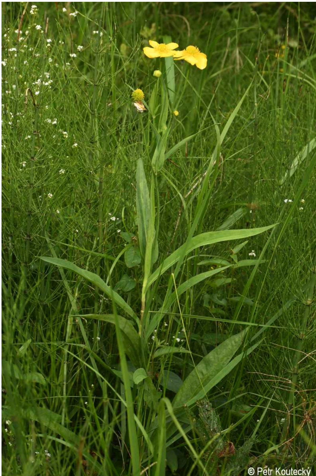
Ranunculus lingua – Petr Koutecký – Olšina.