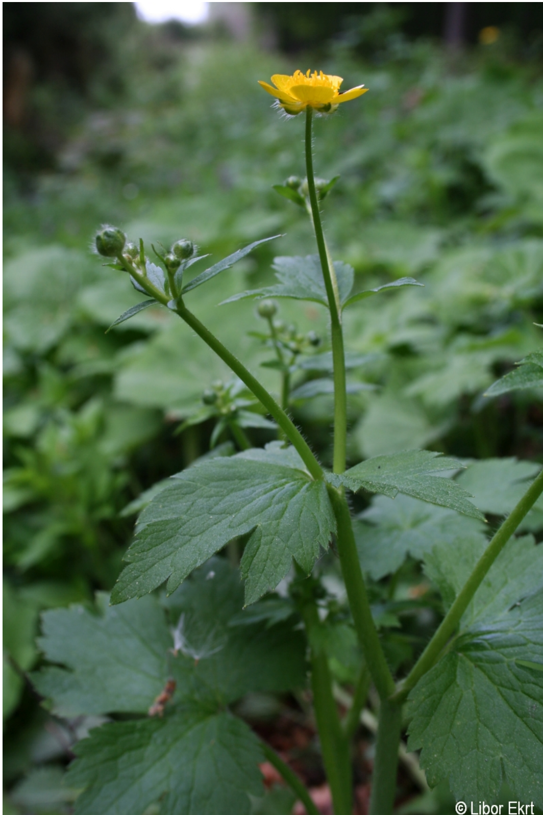
Ranunculus lanuginosus – Libor Ekrť – Stožec.