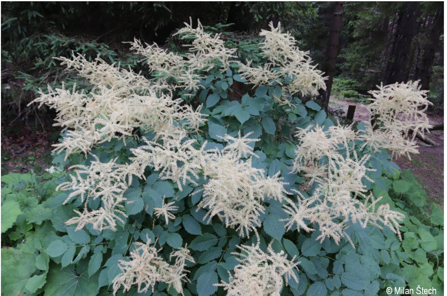
Aruncus dioicus – Milan Štech – Debrník.