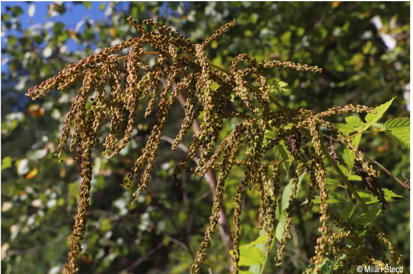
Aruncus dioicus – Milan Štech – Dračí skály.