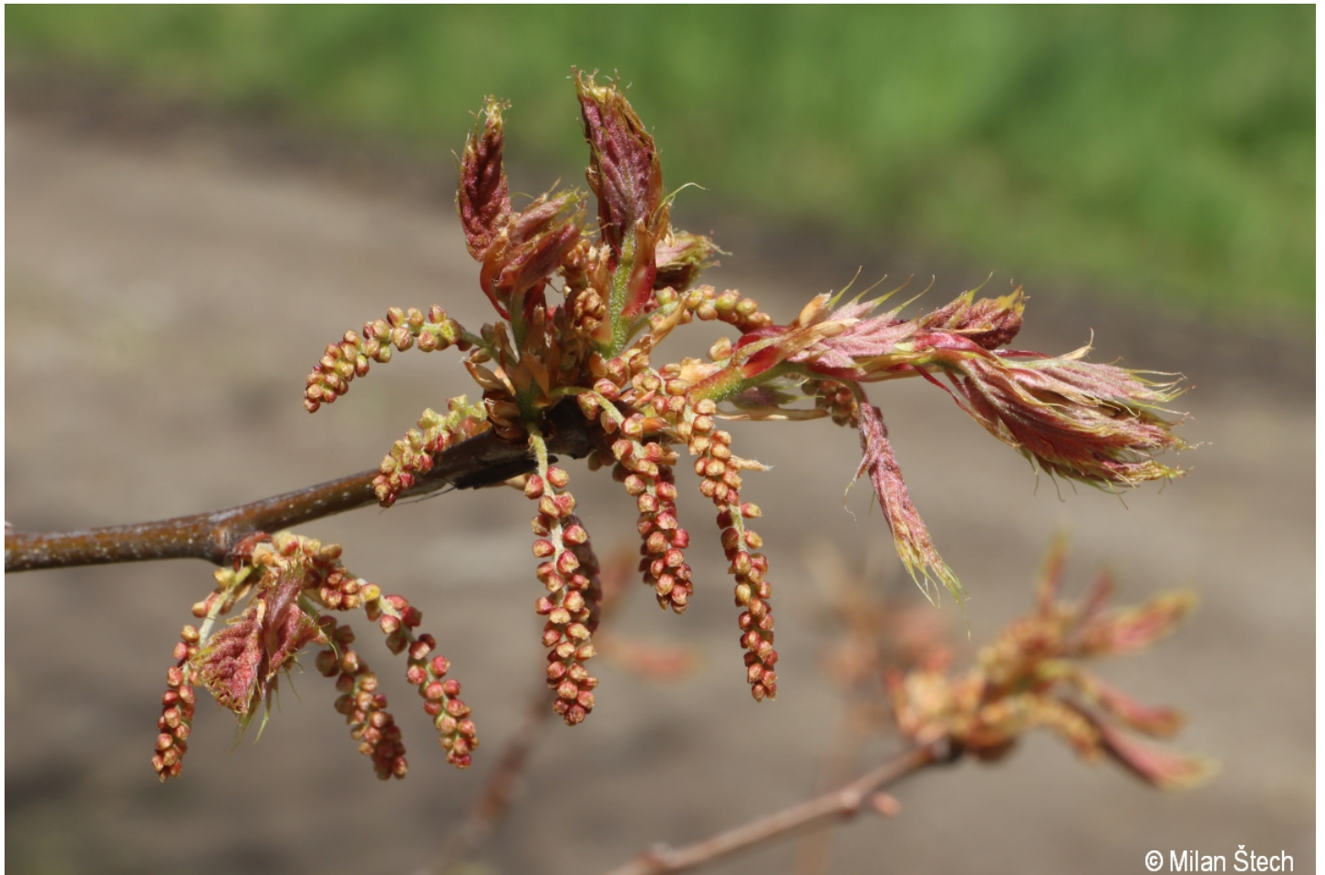
Quercus rubra – Milan Štech – Včelná pod Boubínem.