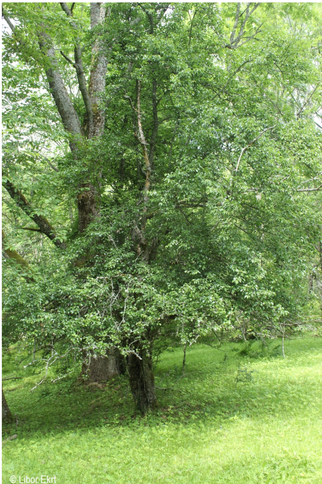
Pyrus communis – Libor Ekrť – Pestřický vrch.