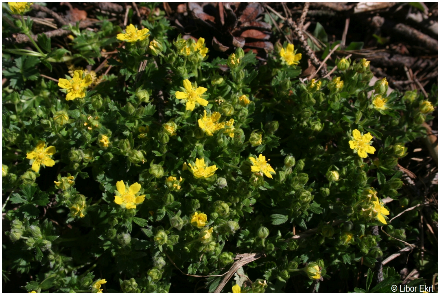
Potentilla verna – Libor Ekrt – Soumarský Most.