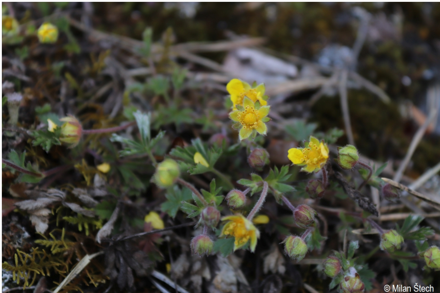
Potentilla puberula – Milan Štech – Černá v Pošumaví.