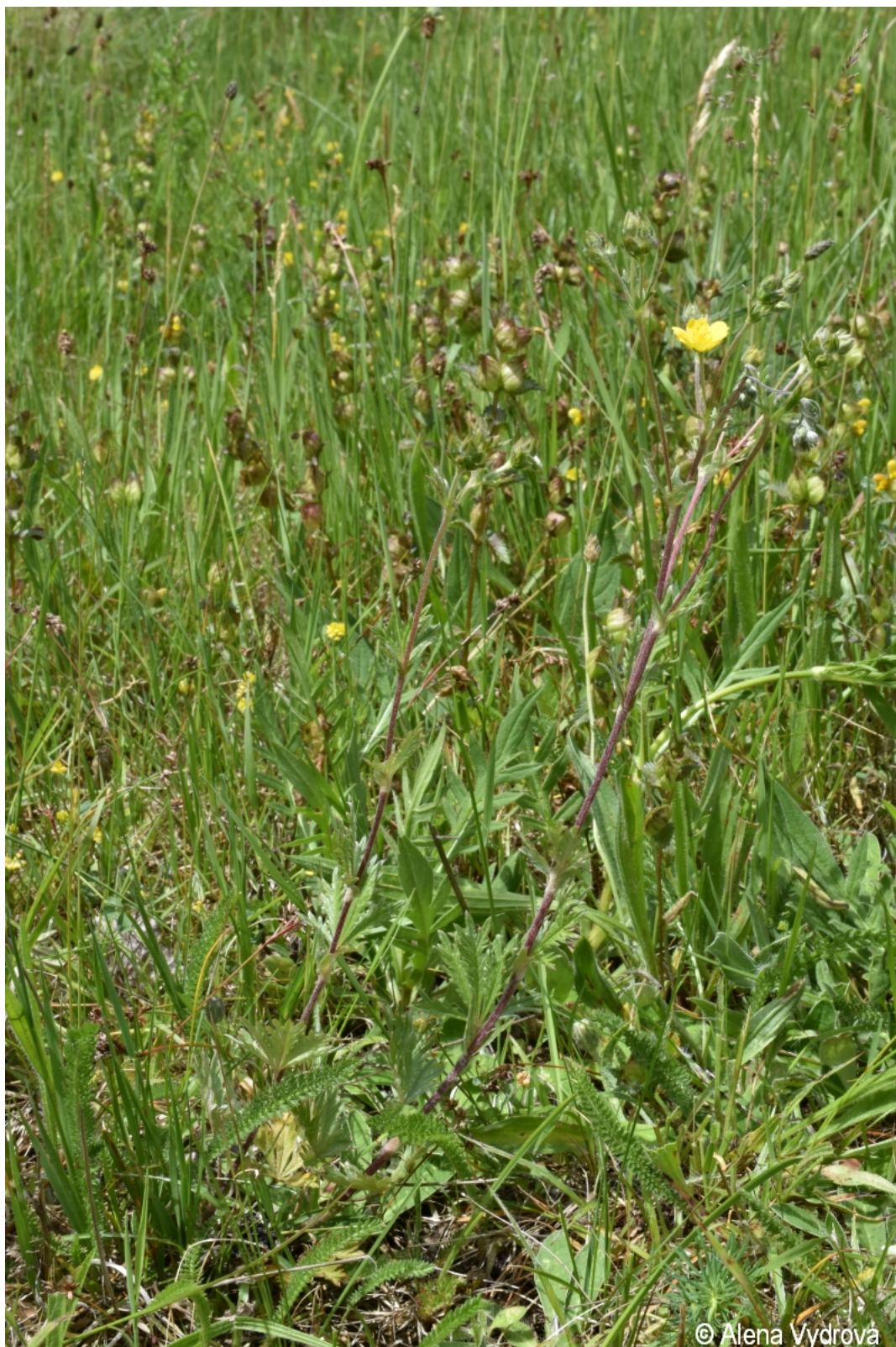
Potentilla inclinata – Alena Vydrová – Boletice.