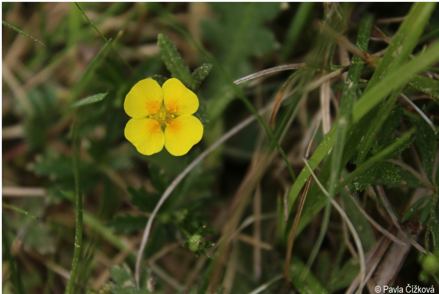
Potentilla erecta – Pavla Čížková – Zátoň, Kaplice.