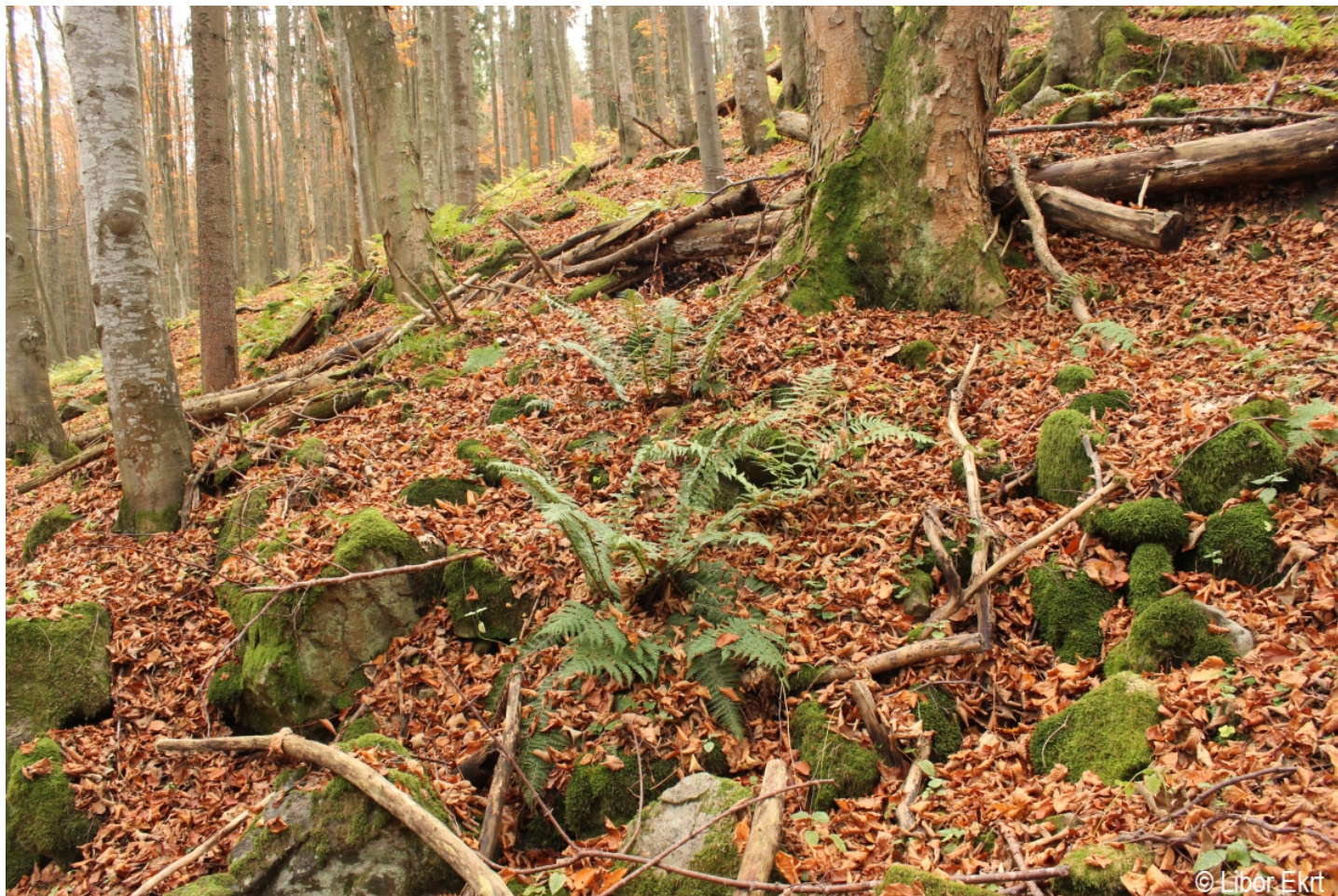
Polystichum aculeatum – Libor Ekrť – Stožec.