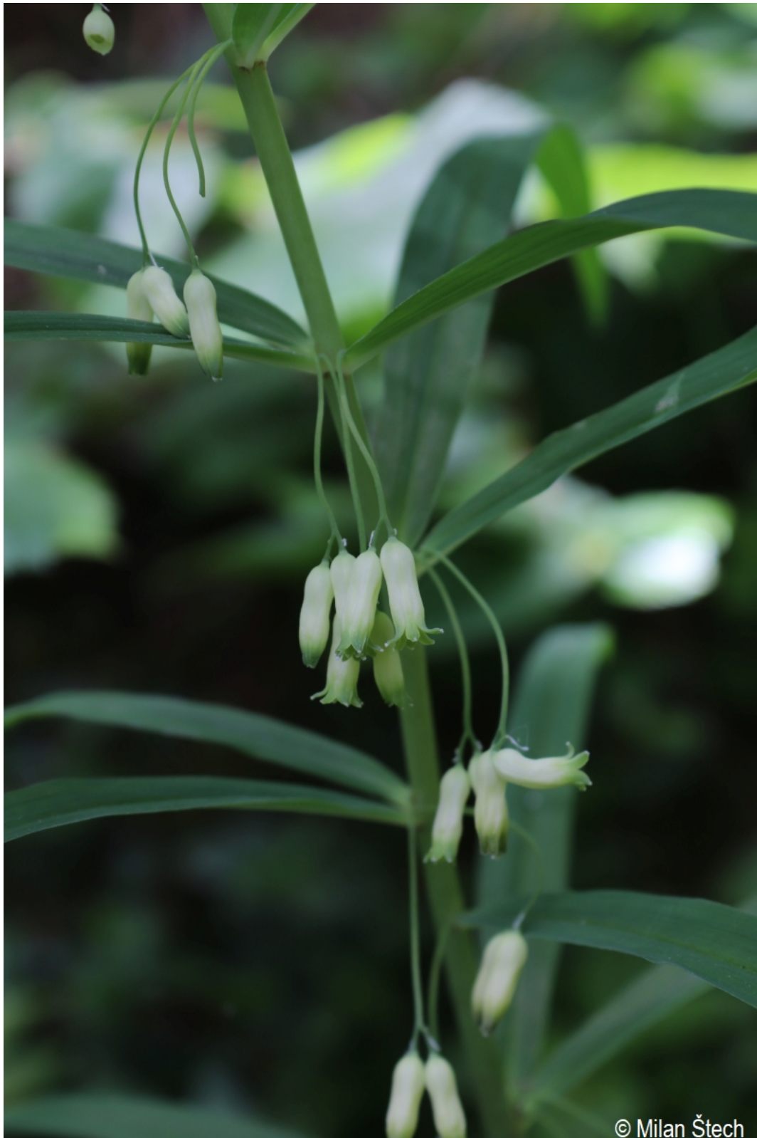
Polygonatum verticillatum – Milan Štech – Olšina, Suchý vrch.