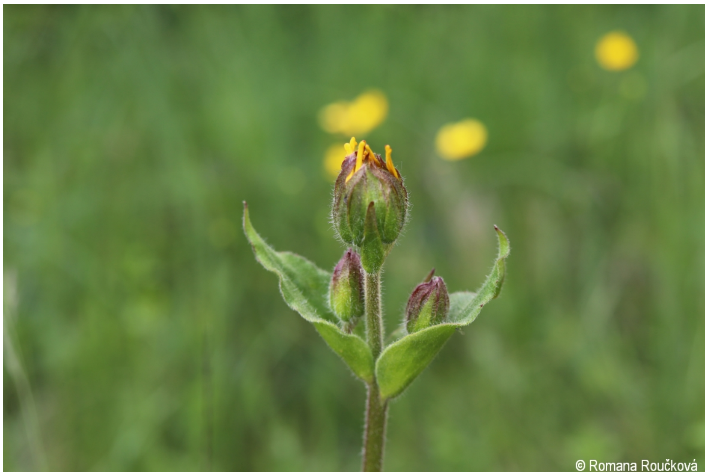
Arnica montana – Romana Roučková – Horský potok.