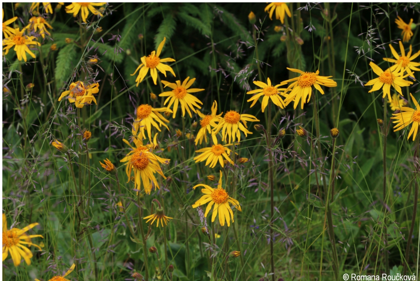
Arnica montana – Romana Roučková – Žďárecká slat'