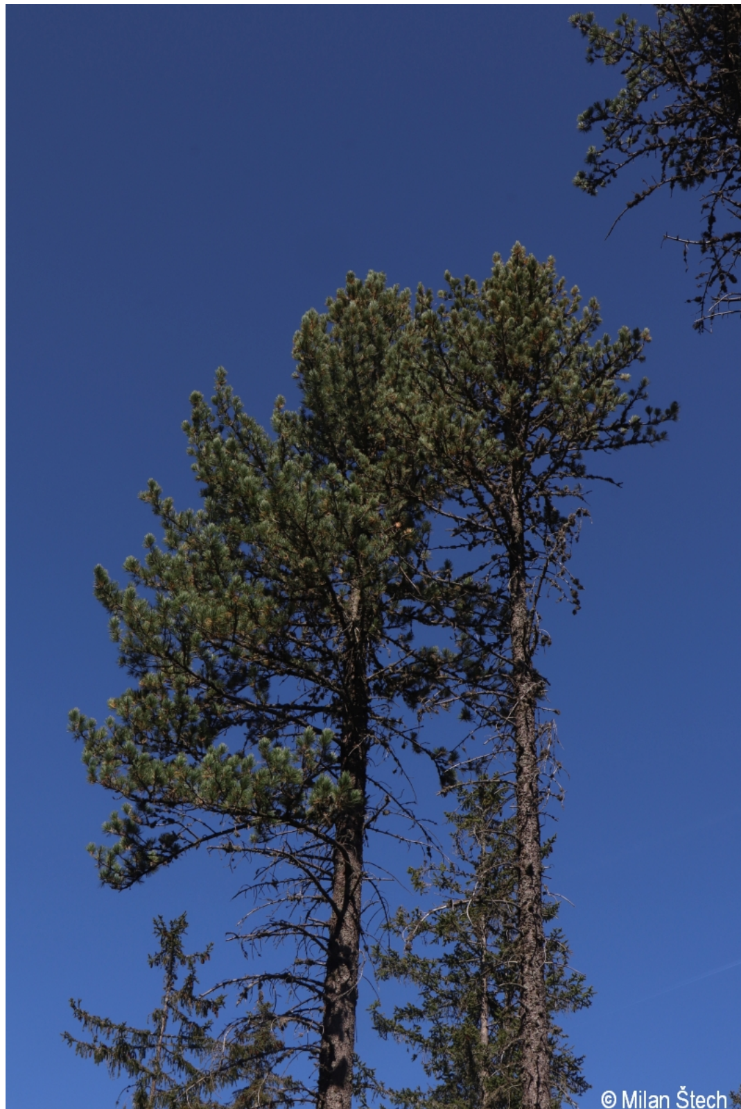
Pinus cembra – Milan Štech – Antýgl.