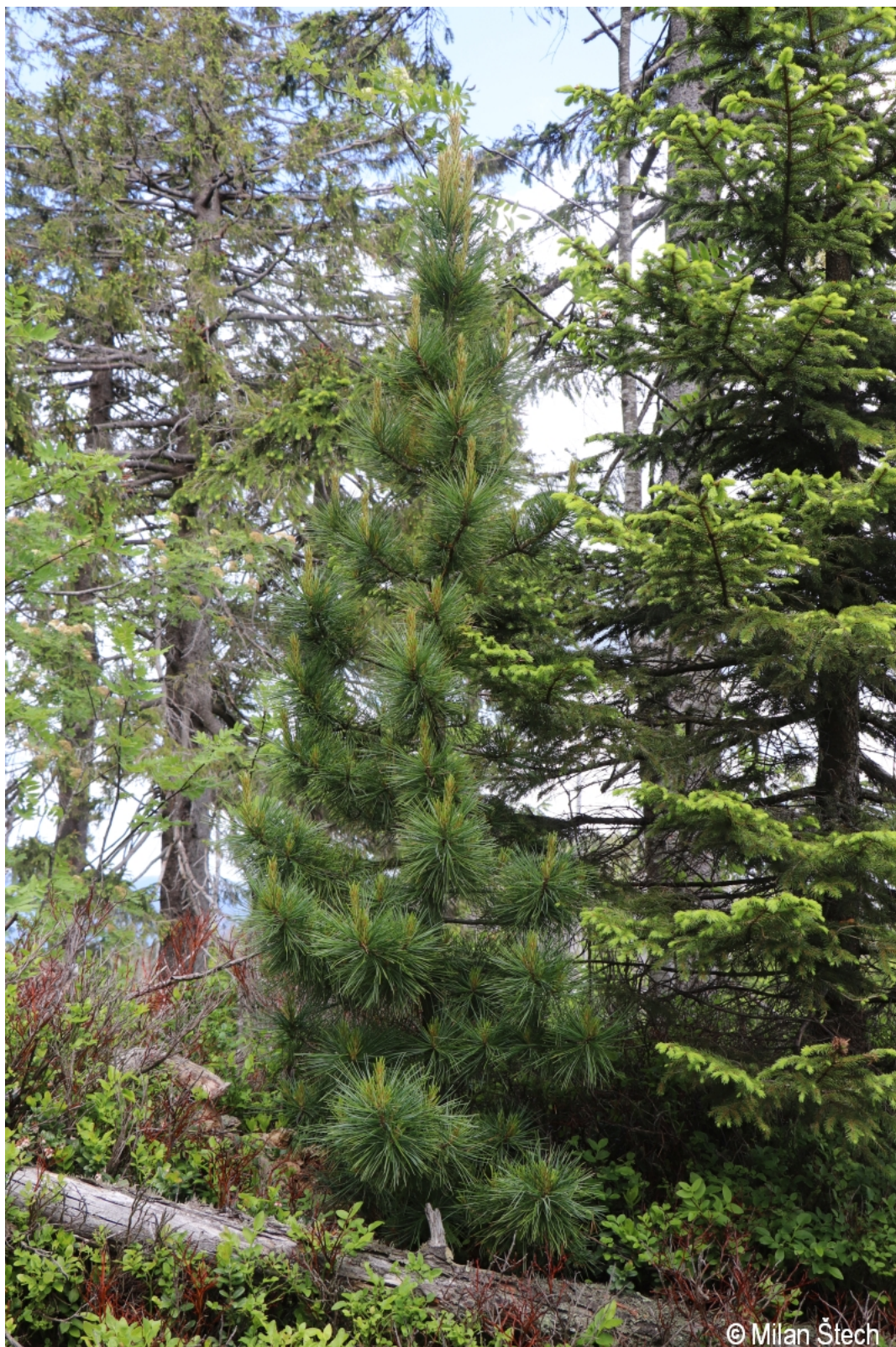
Pinus cembra – Milan Štech – Schönbergfelsen.