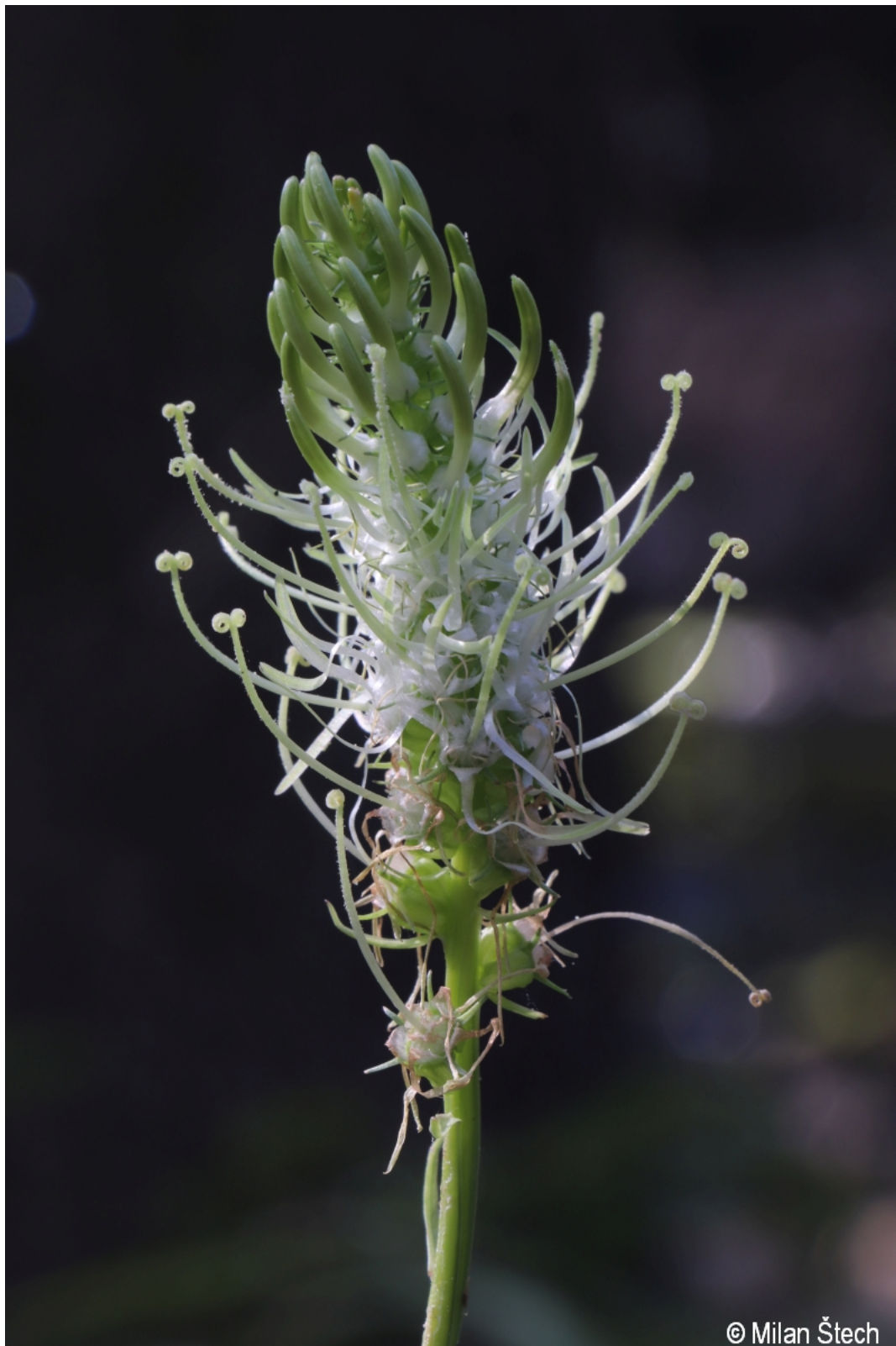
Phyteuma spicatum – Milan Štech – Březník.