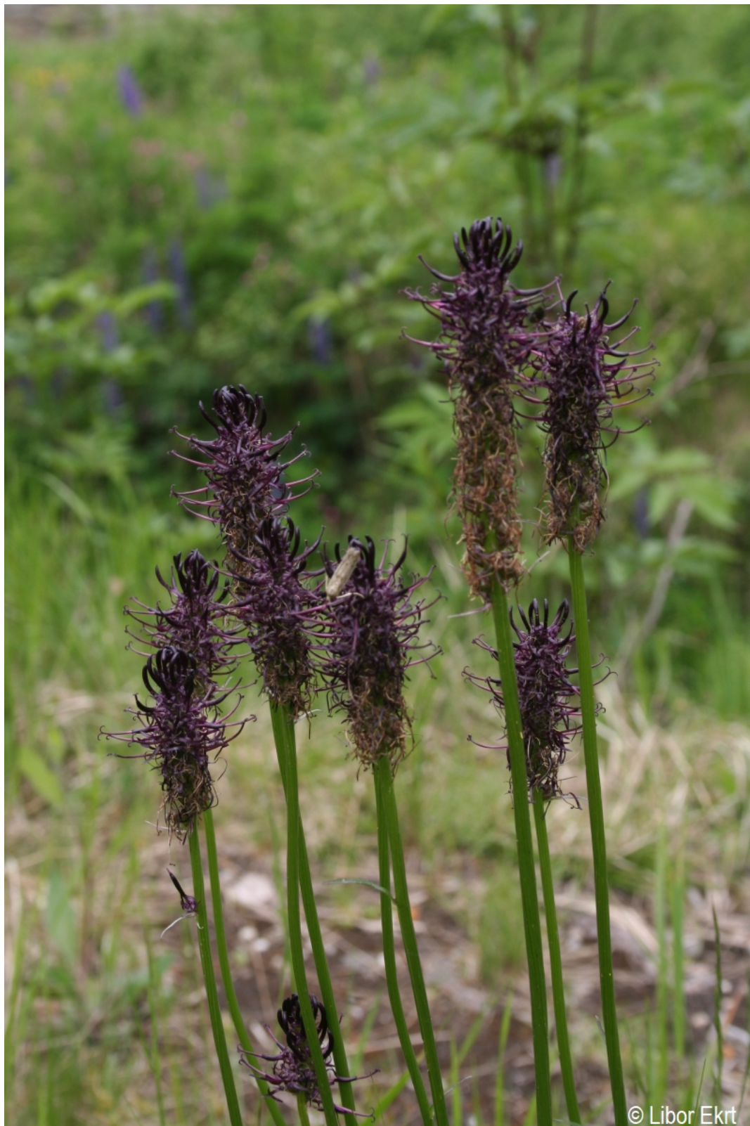
Phyteuma nigrum – Libor Ekrt – Modrava.