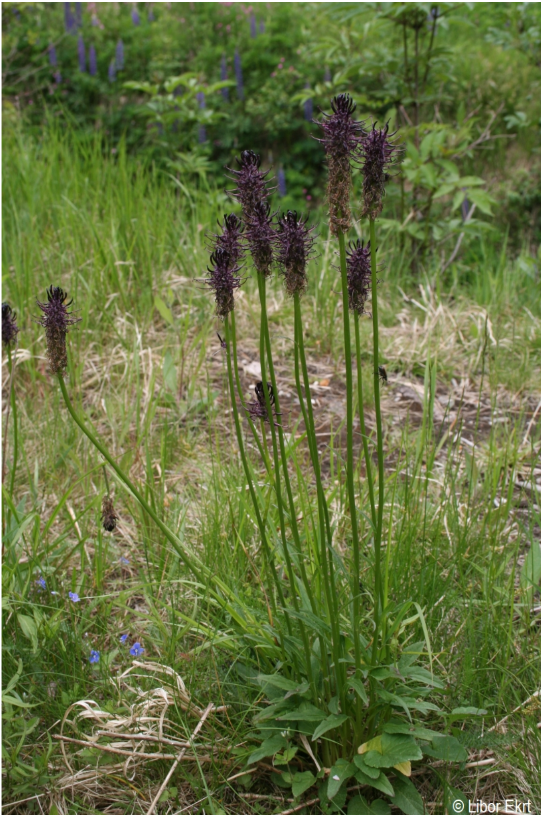
Phyteuma nigrum – Libor Ekrt – Modrava.