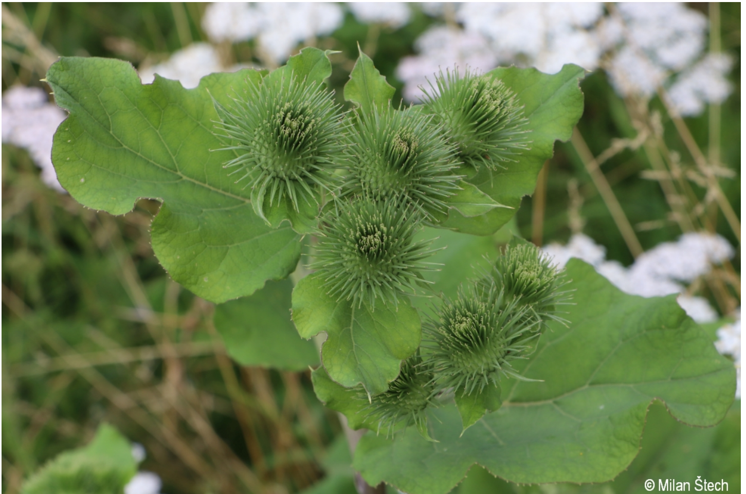
Arctium lappa – Milan Štech – Karlovy Dvory.