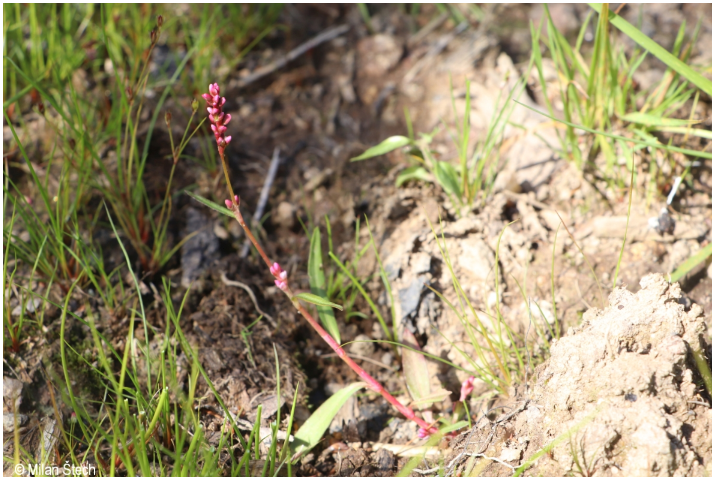
Persicaria minor – Milan Štech – Kamenná Lhota.