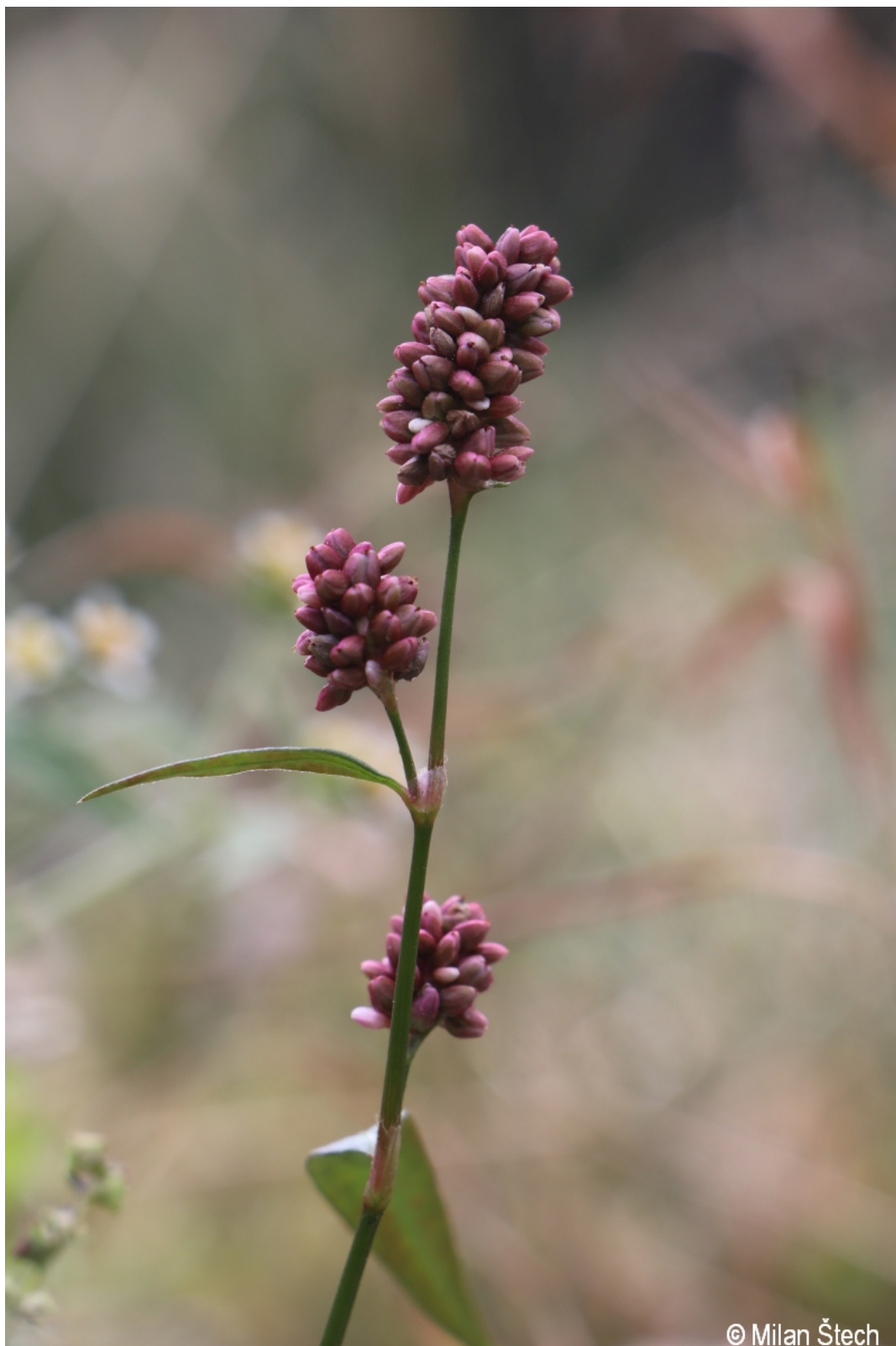
Persicaria maculosa – Milan Štech – Hindenburgkanzel.