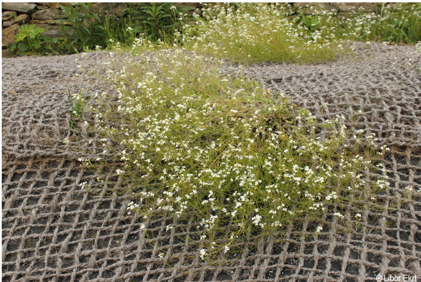
Arabidopsis halleri – Libor Ekrť – Kvilda.