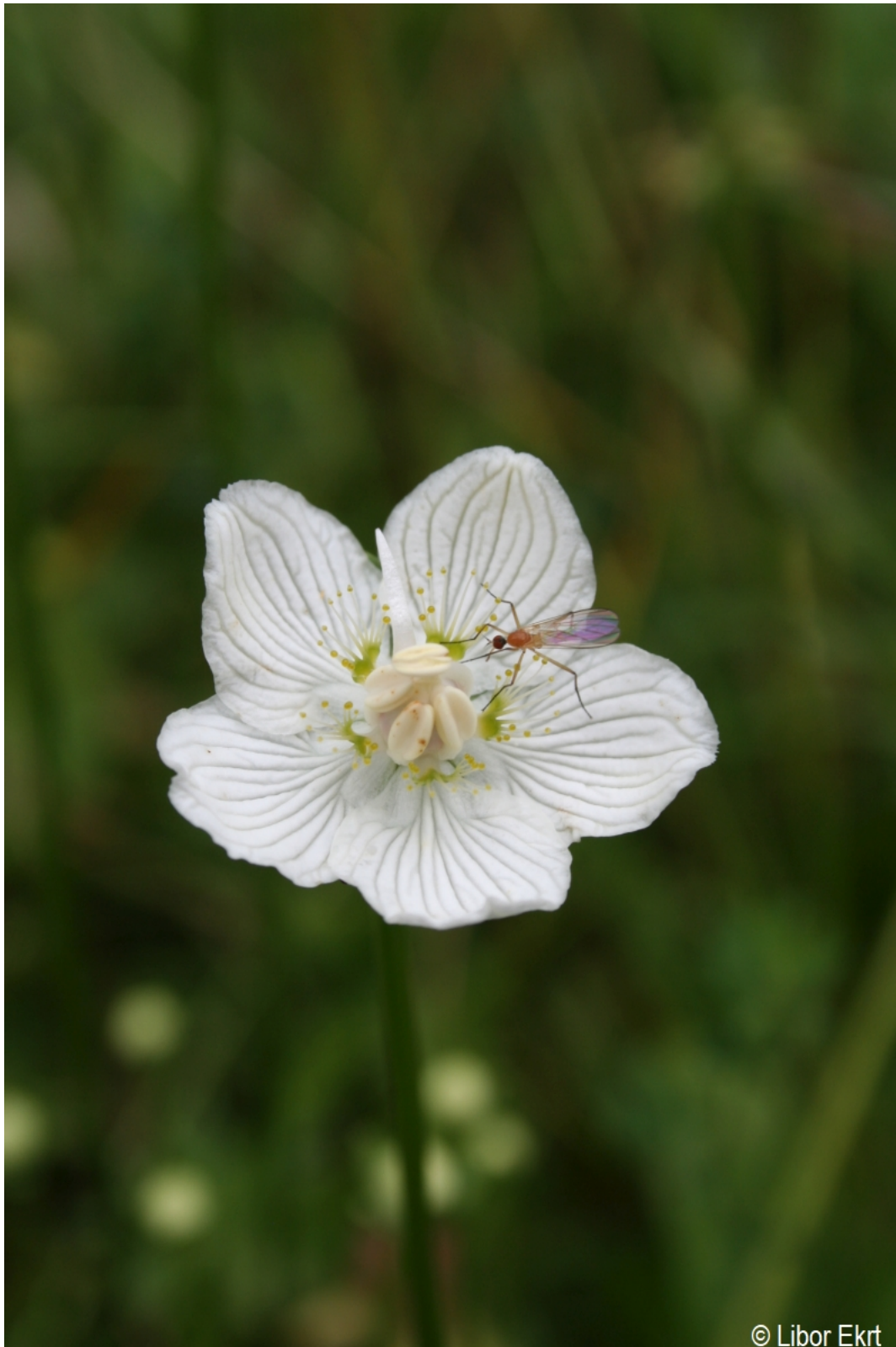
Parnassia palustris – Libor Ekrť – Prášily, Slunečná.