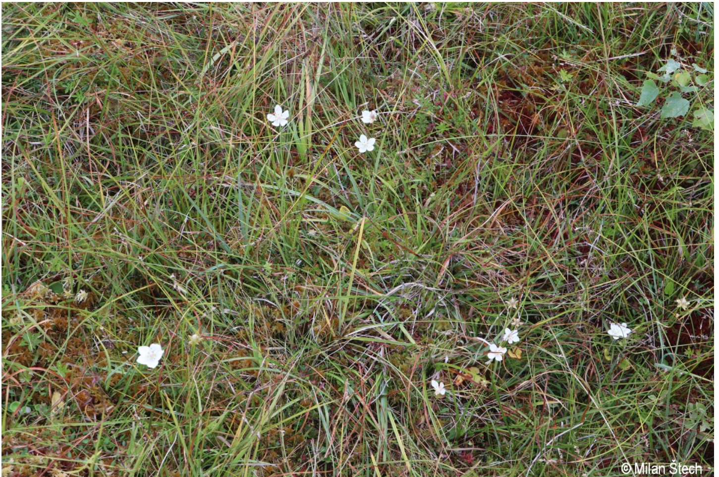
Parnassia palustris – Milan Štech – Červený potok.