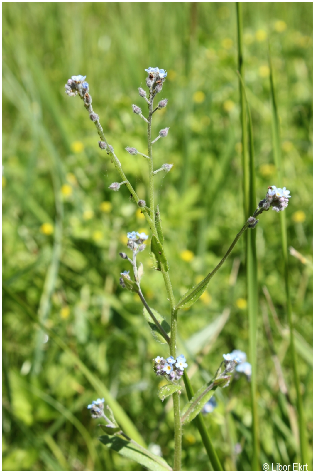
Myosotis arvensis – Libor Ekrť – Hodňov.