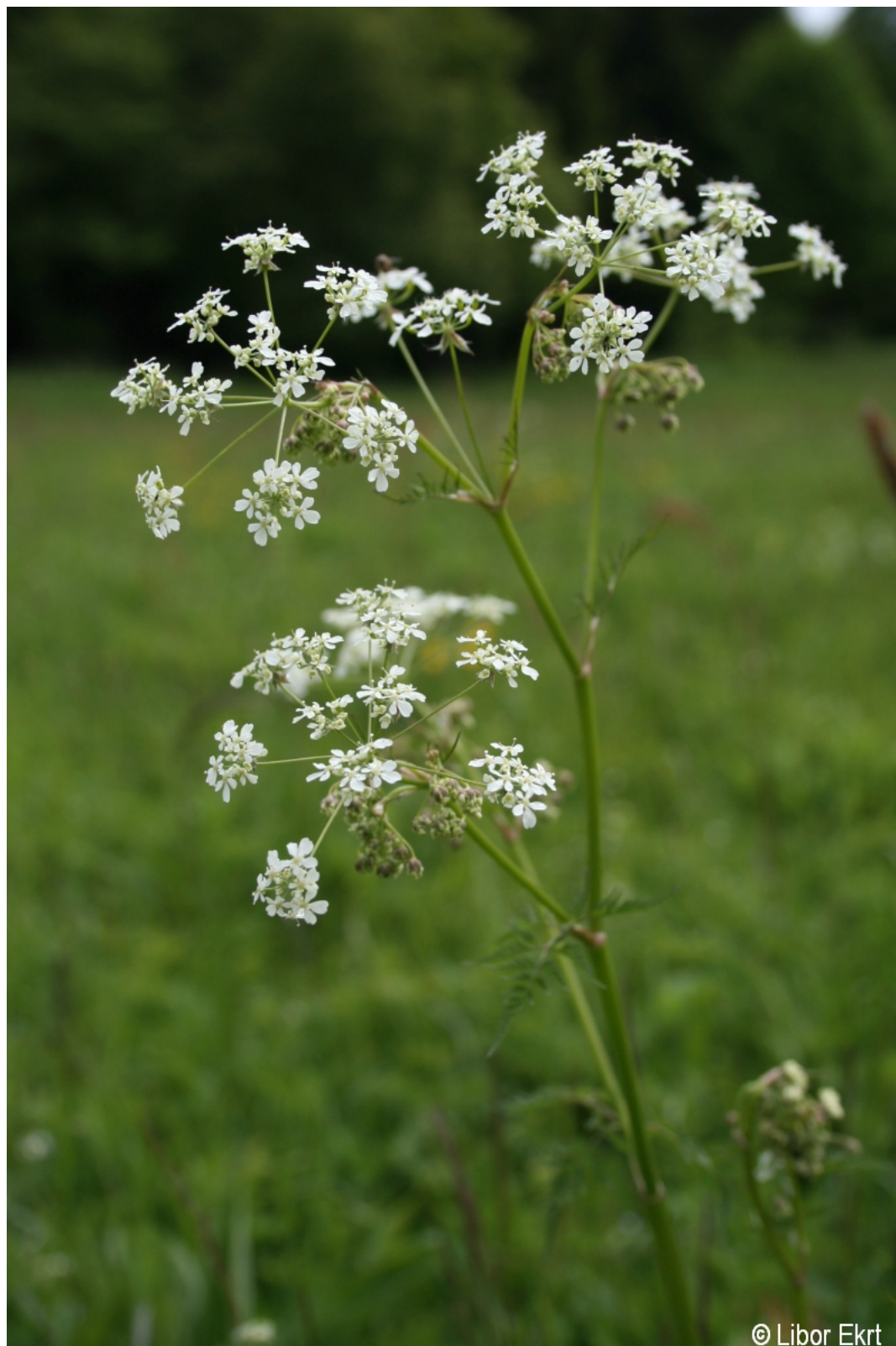
Anthriscus sylvestris – Libor Ekrť – Havránka.