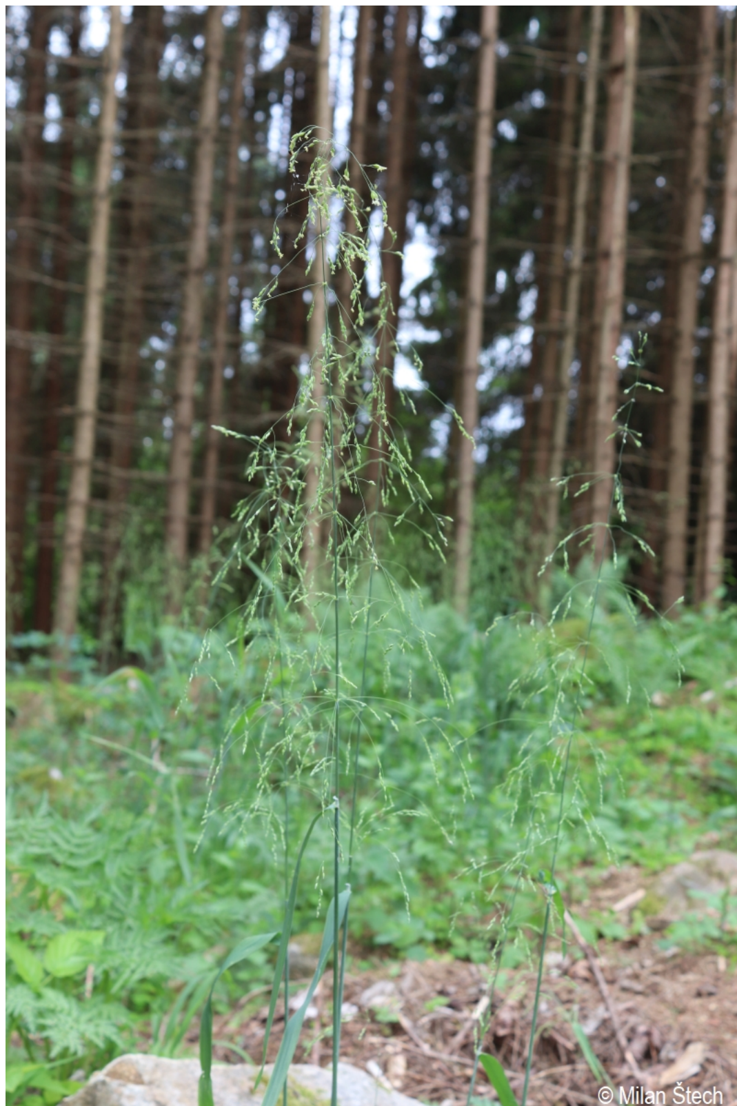
Milium effusum – Milan Štech – Olšina, Suchý vrch.