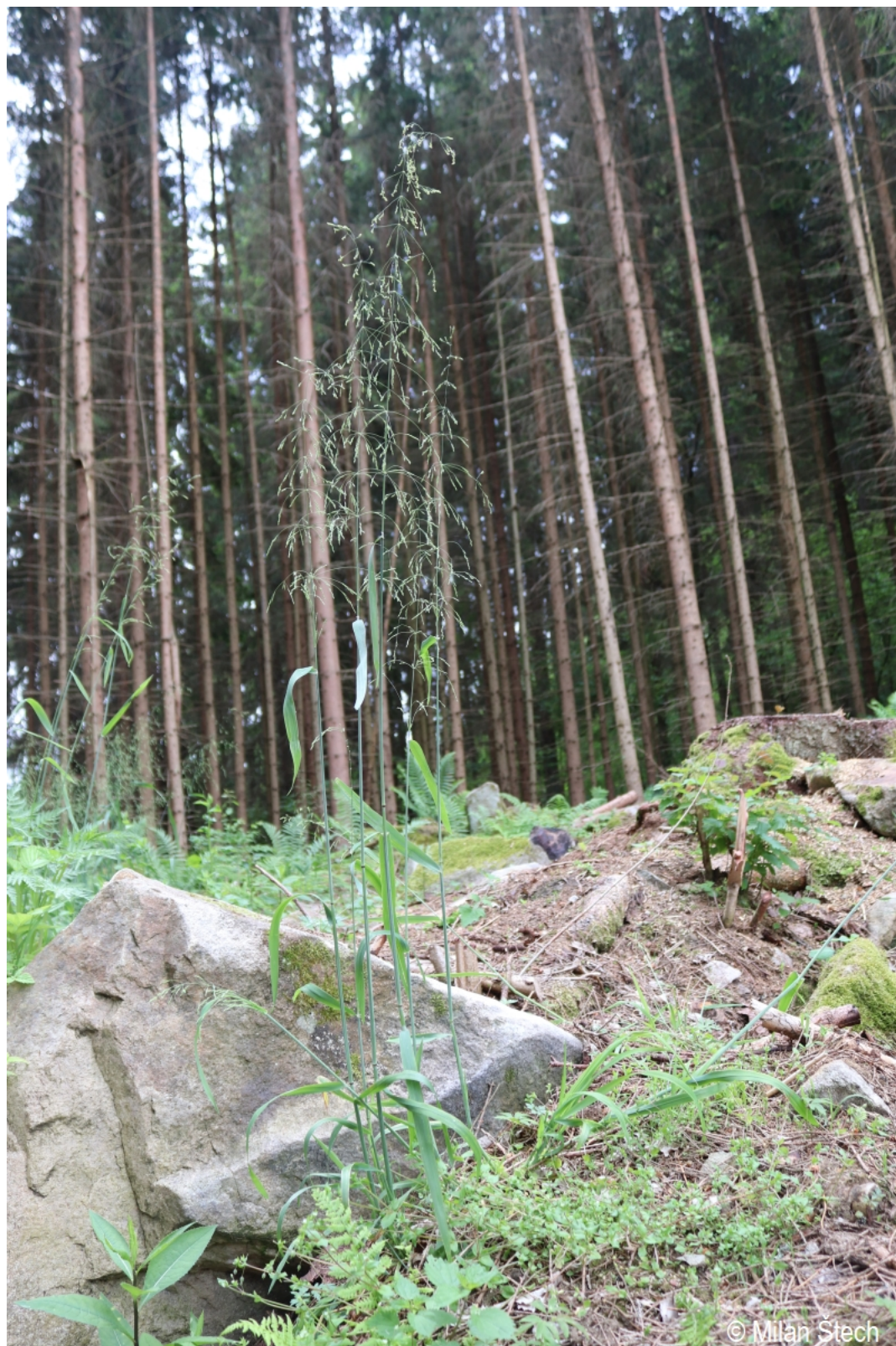
Milium effusum – Milan Štech – Olšina, Suchý vrch.