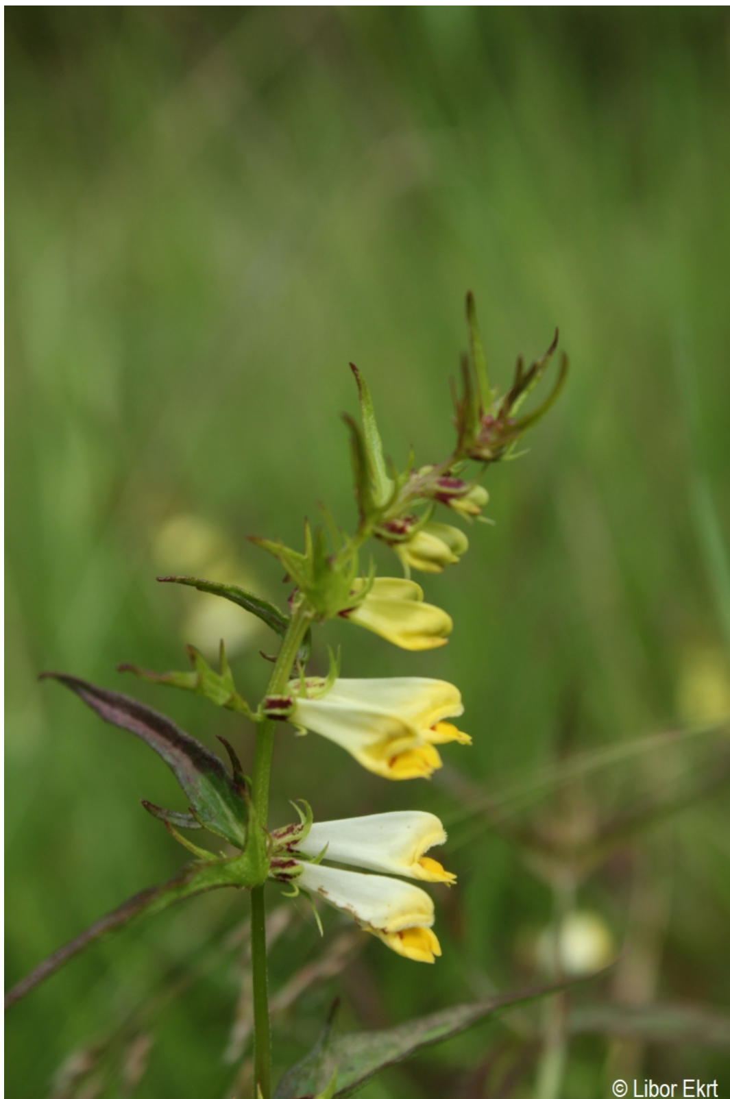
Melampyrum pratense – Libor Ekrť – Házlův kříž.