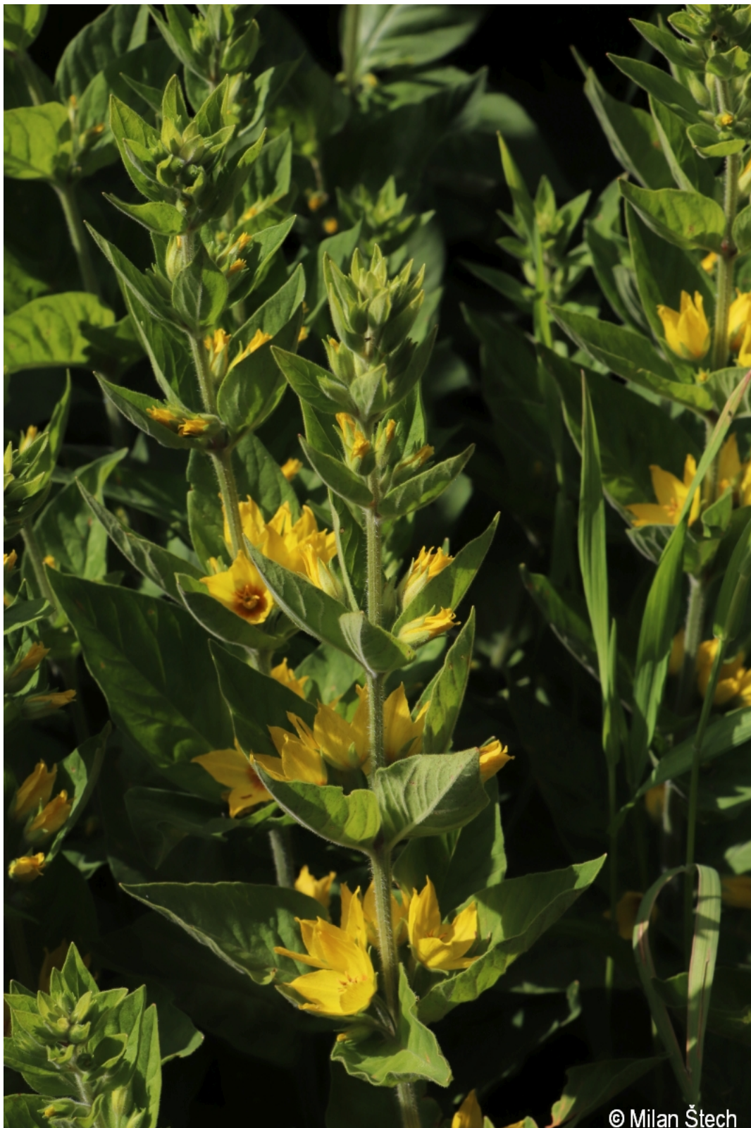
Lysimachia punctata – Milan Štech – Waldhauser.