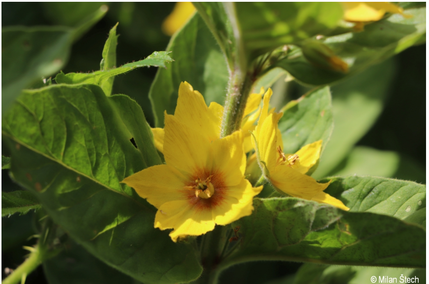
Lysimachia punctata – Milan Štech – Waldhauser.