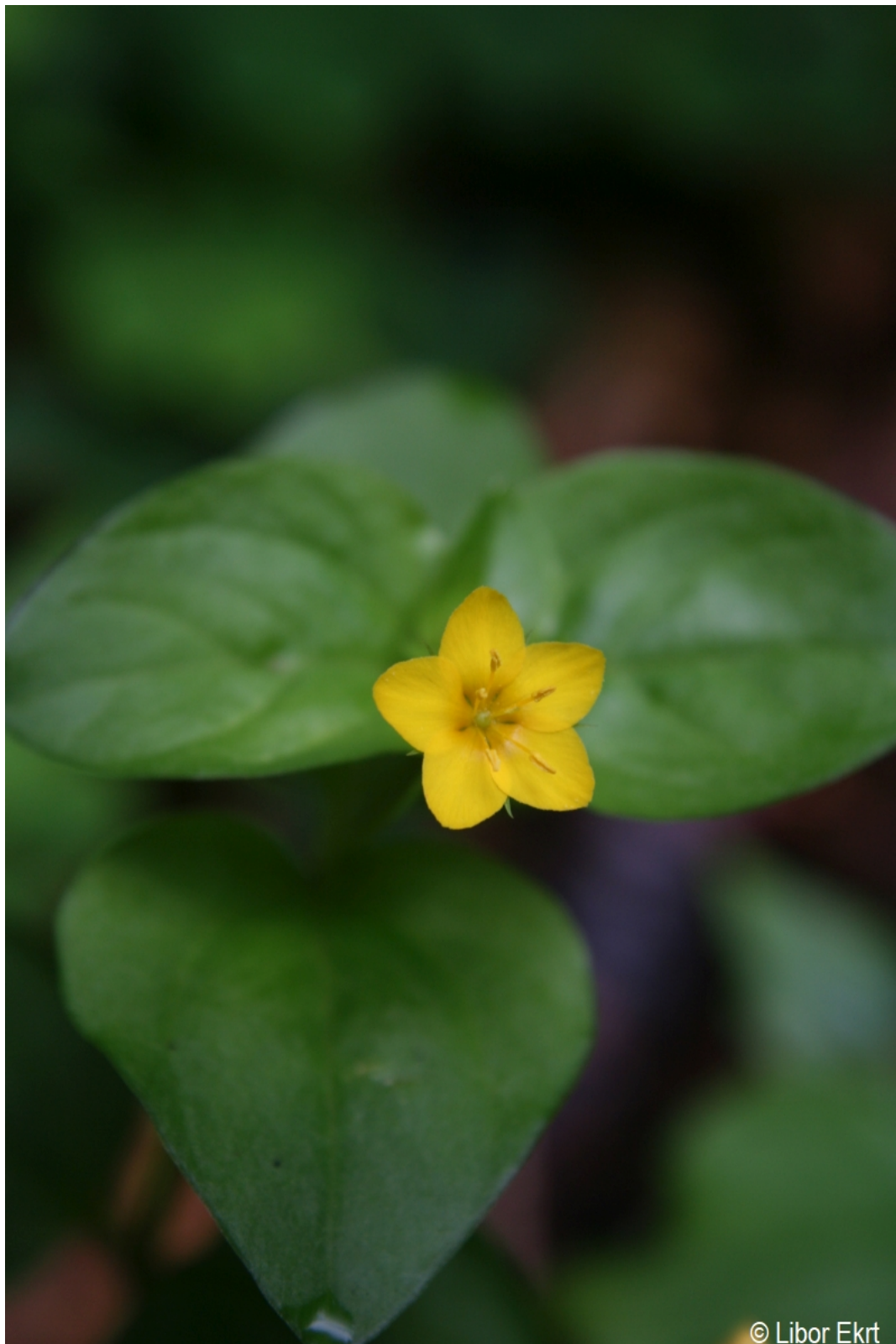
Lysimachia nemorum – Libor Ekrt – Spáleníště.