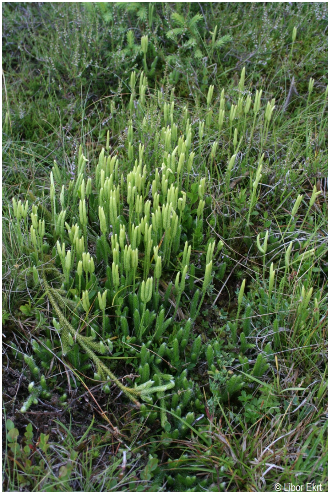
Lycopodium clavatum – Libor Ekrť – Kepelské Zhůří.