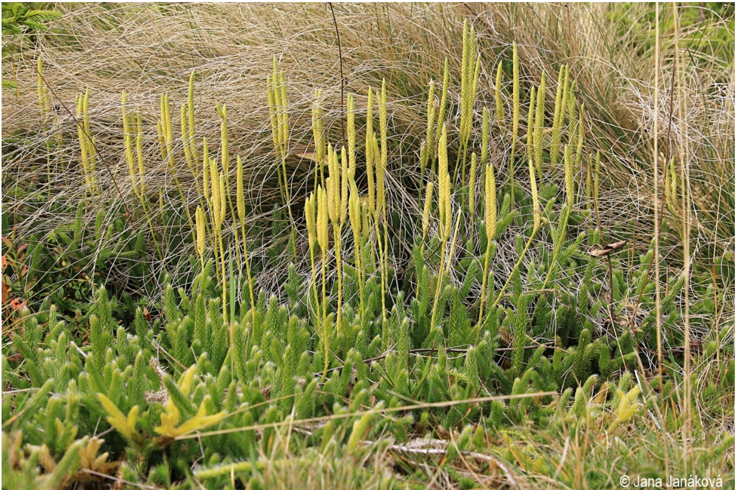
Lycopodium clavatum – Jana Janáková – Lusen.