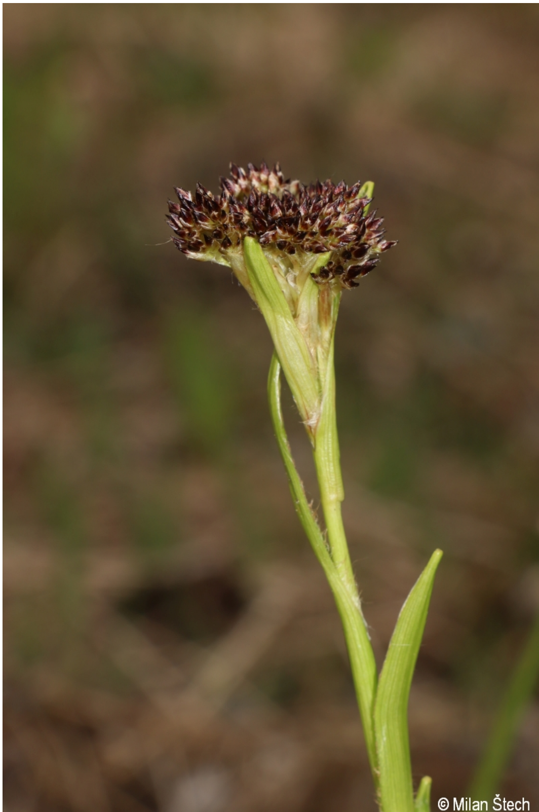
Luzula sylvatica – Milan Štech – Spicking.