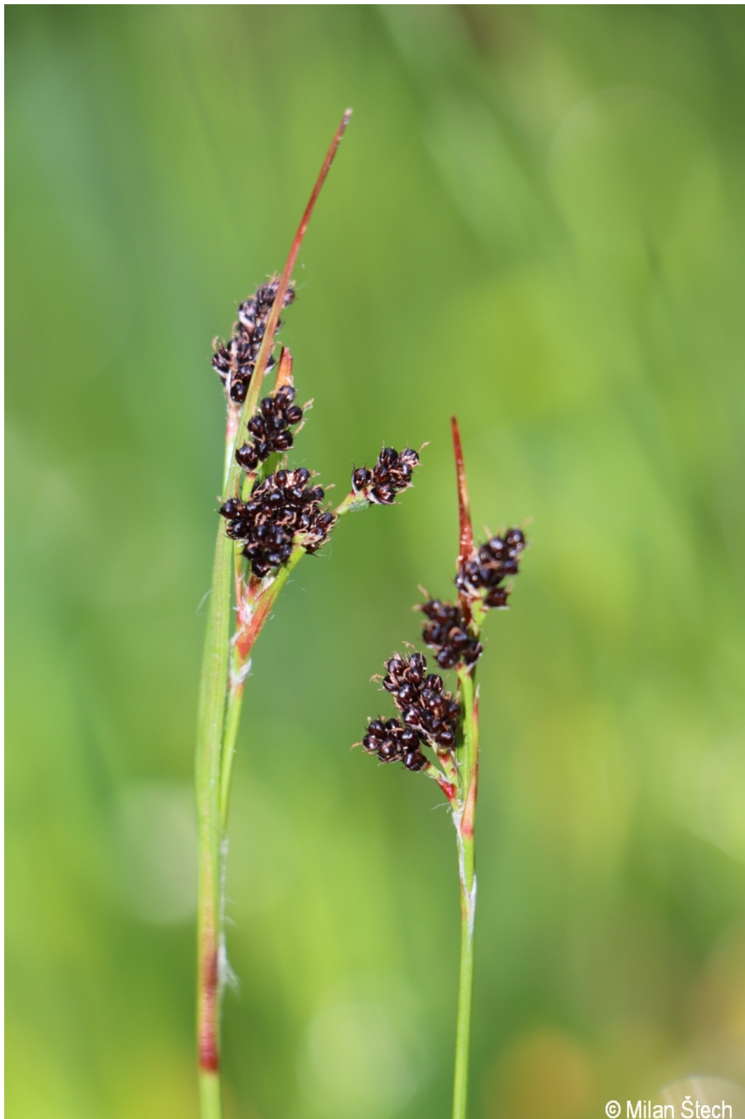
Luzula sudetica – Milan Štech – Svatý Tomáš.