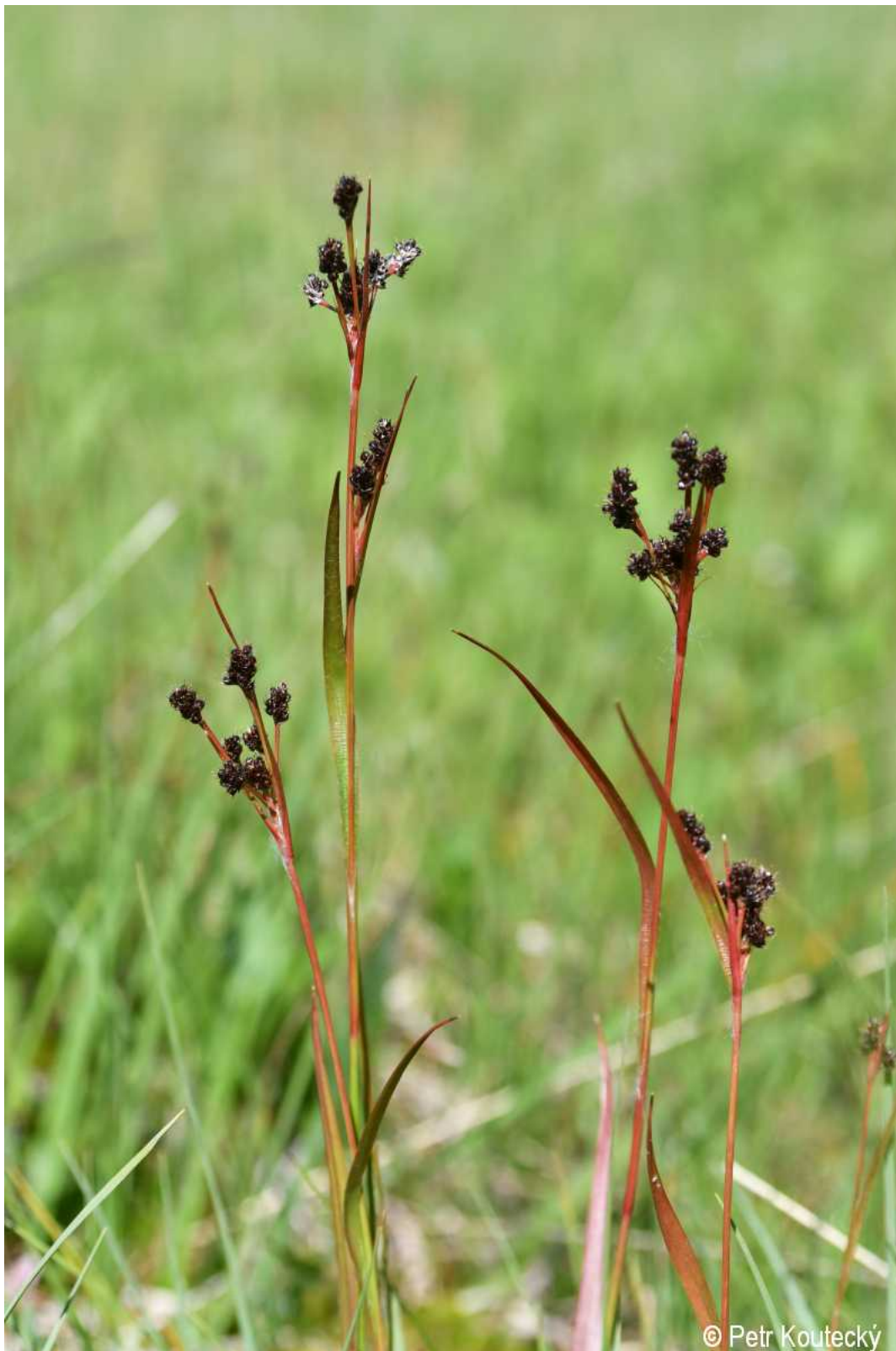
Luzula sudetica – Petr Koutecký – Sv. Tomáš, Horský potok.