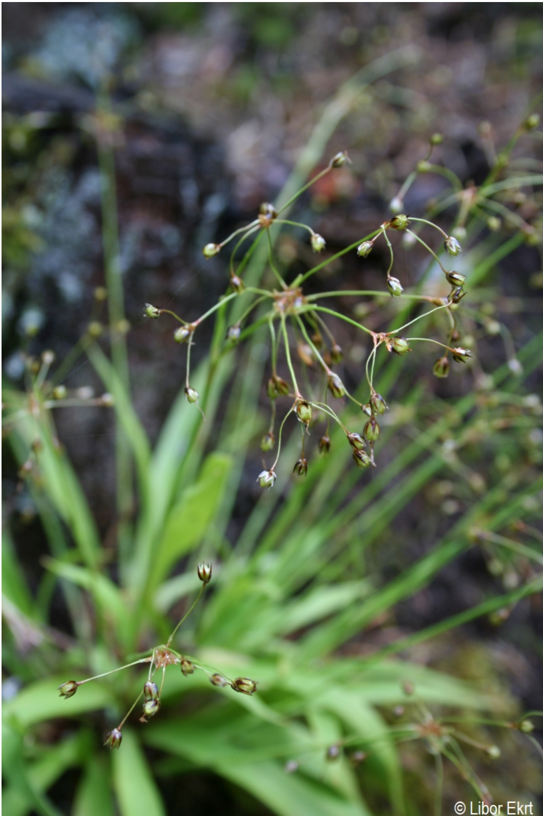
Luzula pilosa – Libor Ekrt – Vydra.