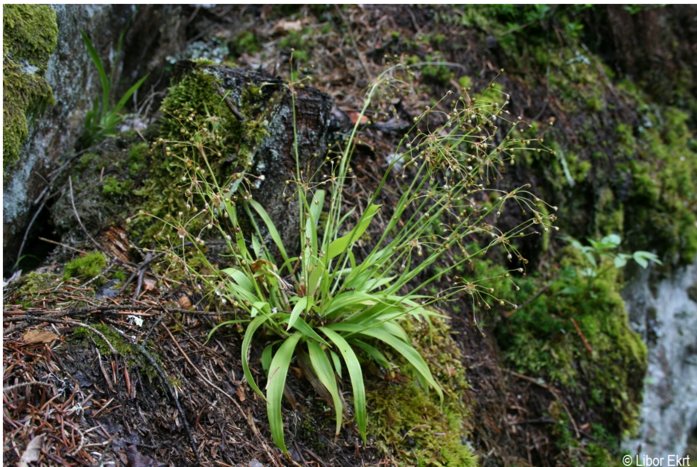
Luzula pilosa – Libor Ekr – Vydra.