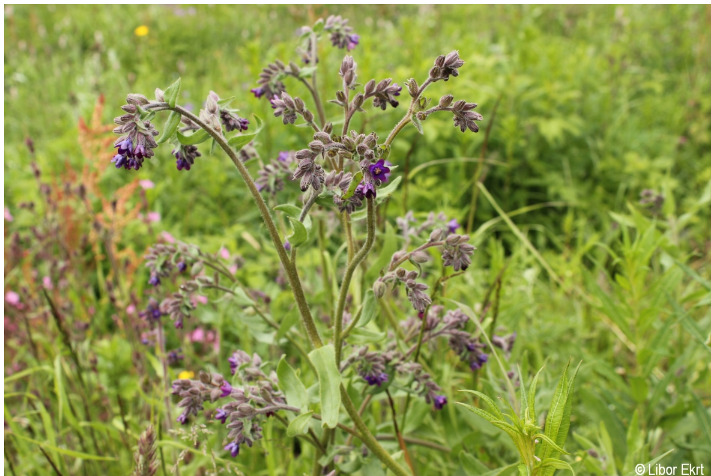
Anchusa officinalis – Libor Ekrť – Kvilda.