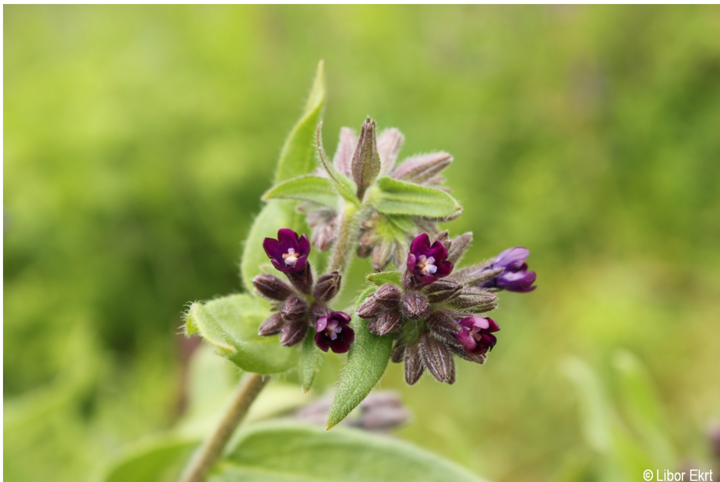
Anchusa officinalis – Libor Ekrť – Kvilda.