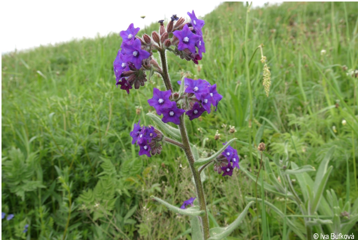
Anchusa officinalis – Iva Bufková – Kašperské Hory.