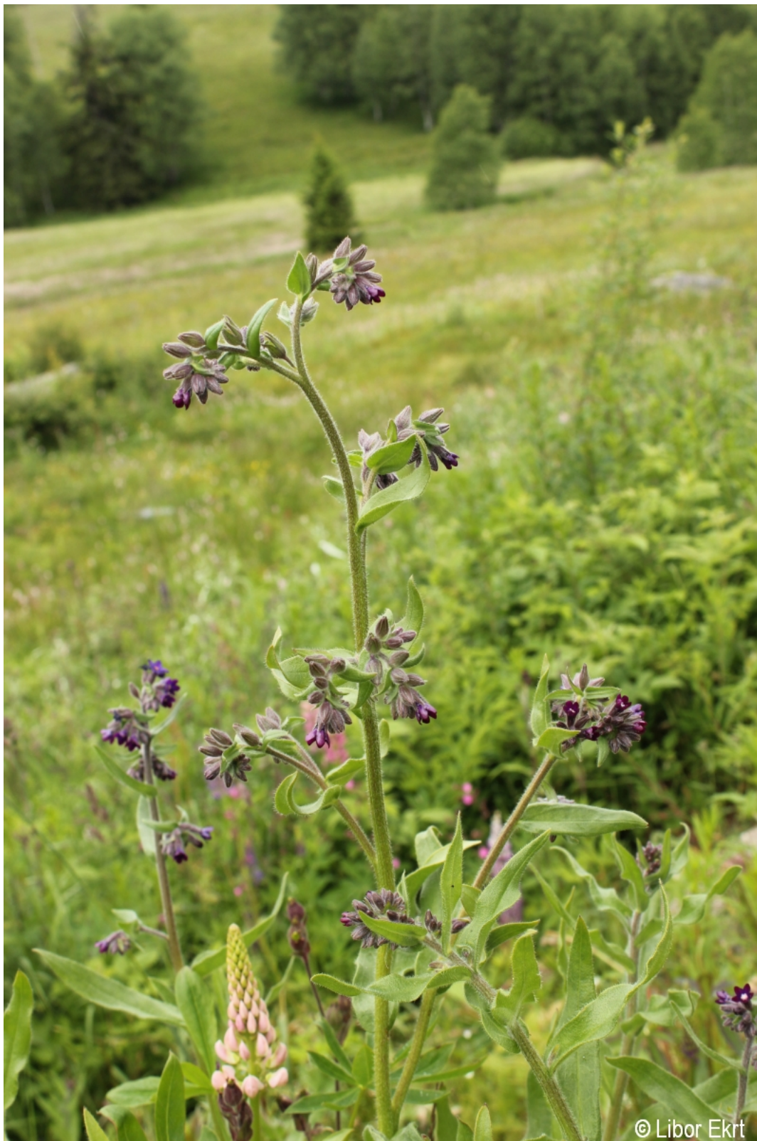
Anchusa officinalis – Libor Ekrť – Kvilda.