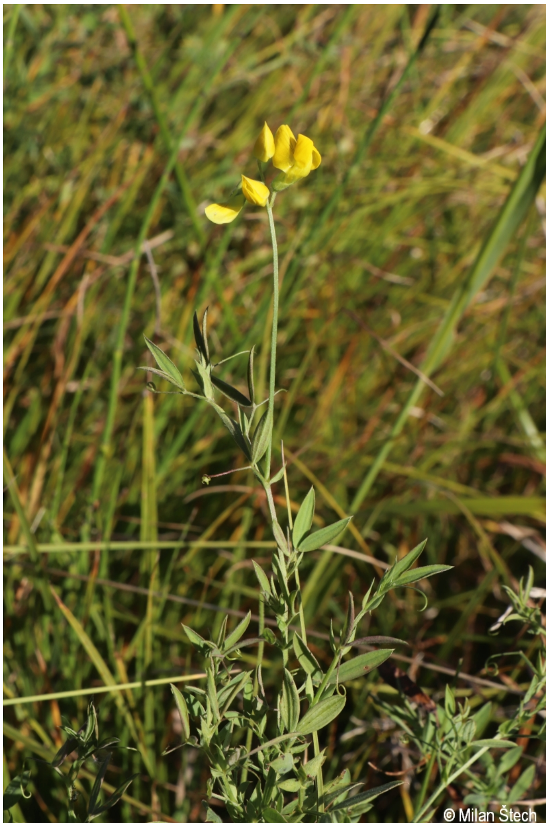
Lathyrus pratensis – Milan Štech – Strážný.