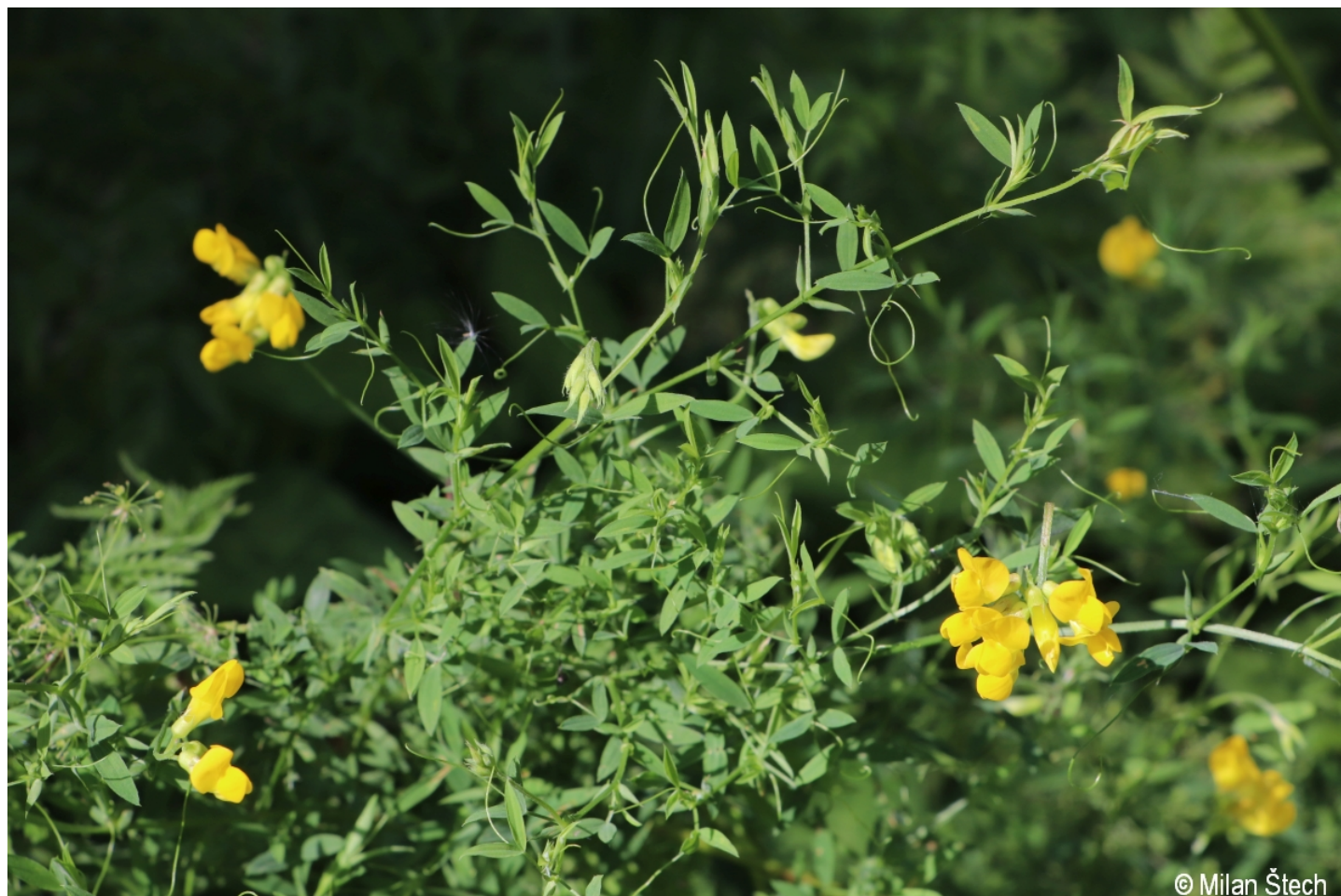
Lathyrus pratensis – Milan Štech – Horská Kvilda, Stará Huť u Zhůří.