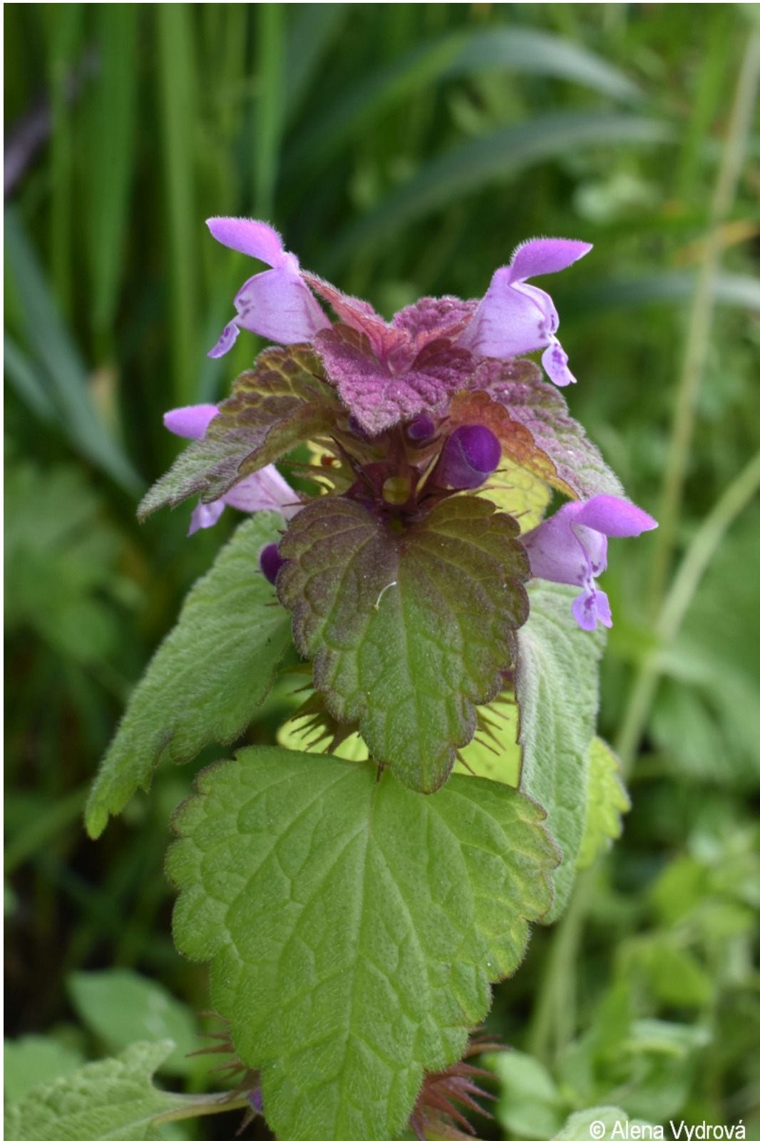
Lamium purpureum – Alena Vydrová – Želnavá.